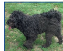
POPEYE 2 éves puli kan