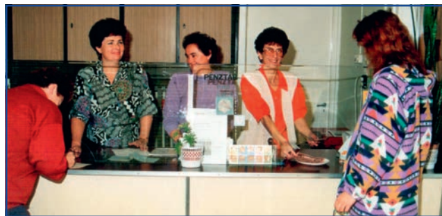
Amikor a Takarékné még szövetkezet volt (2000-es évek)