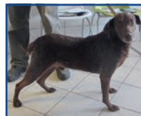
BROWNIE 1,5 éves vizsla keverék kan