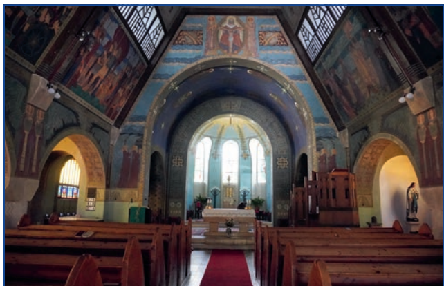
A zebegényi templom

A cikk szerzői arra vállalkoztak, hogy Jászfényszaru híres szülöttéről vagy az itt élőkéről információkat gyűjtsenek, és egy cikksorozatban közreadjanak – az áprilisi, májusi lapszámban már erről olvashattunk. Az arcképcsarnokban azokról emlékezünk meg, akik a tudomány, építéset, művészet tárgyi, szellemi javaival értékeket, örökséget hagytak ránk, jászfényszarusiakra, s akikre méltán lehetünk büszkék – akkor is, ha az élet másfelé vezette útjukat. „Hogy dicső eleink nyomain járni taníthassunk...”