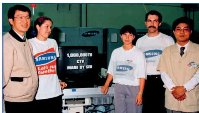
A Samsung egymilliomodik tv-készüléke a szalagról legördült (1997. június 4.)