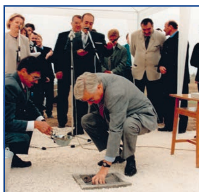
Ipari Park alapkövetétele, ekkor lett megalapozva a város hosszú távú fejlődése. A képen Michael Lake nagykövet, az EU magyarországi delegációjának vezetője és Szűcs Antal ügyvezető, képviselő látható a kapszula elhelyezésénél (2000. október 20.)