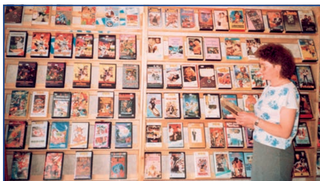
Amikor még Videotéka is volt a városban