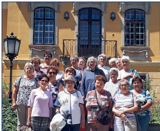
Házunk tája klub Noszvajon · Fotó: Nagy Ildikó

Itt a barlanglakások bejáratánál, de még számtalan helyen találkoztunk a Meseút állomásaival. A kis ládák egy-egy mesét rejtenek feladatokkal, amelyet a séta alatt kell megfejtenie a résztvevőknek. Utunk következő állomása a pompás De La Motte-kastély volt,