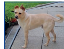
REGE 5 éves kistestű keverék kan