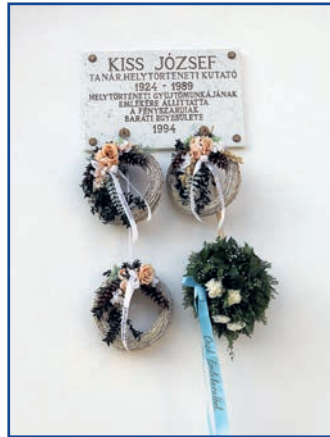
A koszorúk a ház falán, a tábla alatt