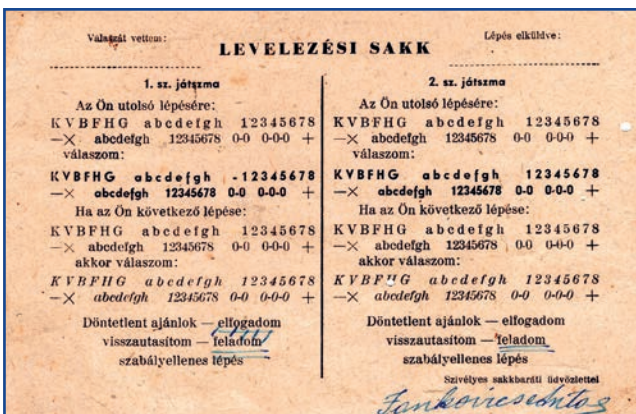
A levelező lap elő és hátlapja

Külön erre a célra nyomtatott (mint jelen esetben) levelezőlapon vagy felirat nélküli hátlapú levelezőlapon is.