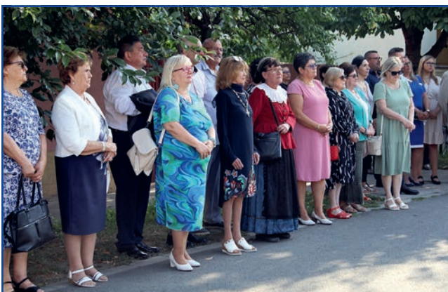
A megjelentek egy csoportja