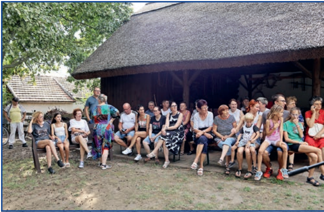
Ákik kiszorultak a színelöl

A szokott helyen és időpontban rendezte meg a XIII. Kemence ünnepét a Fényszaruiai Baráti Egyesülete és alapítványa.