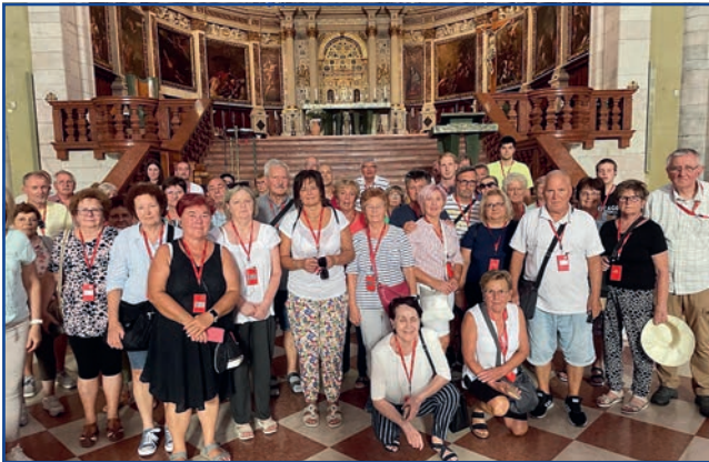
Vicenza – a Dóm szentélye előtt készült csoportkép.

A Nyugatrómai Birodalom bukása után Attila hunjai pusztították a várost. I. Lajos magyar király az első nápolyi hadjárata során, Nápoly felé menet, 1347. december 4-én érintette a várost. Tiszteletére 300 lovaggal vonultak ki elé. Vicenza 1405-től velencei uralom alá került, és ettől kezdve Velence sorsában osztozott. A város az idegenforgalmán túl leginkább ékszerkészítőről és ruhaiparáról híres. Évente háromszor rendeznek világhírű Aranykiállítás. Vicenza ősi római város, de sajnos ókori építmény nem sok maradt a városban, csak három híd és a csatorna-rendszer maradványai. Építészeti szempontból a város összképét főként az Andrea Palladio (1508–1580) és Vincenzo Scamozzi (1548–1616) által tervezett épületek adják.