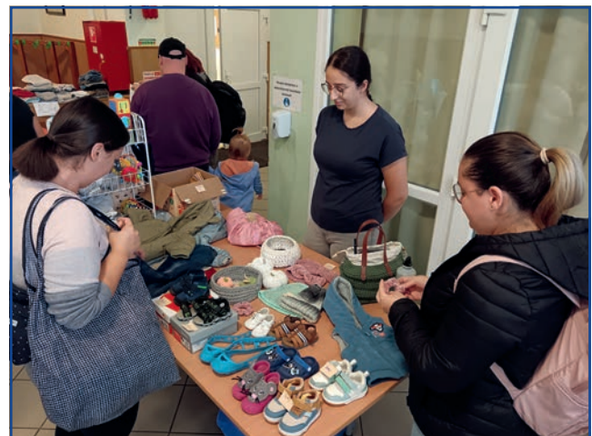
A szeptember 14-ei bababörzén sok gyermekruha és játék talált új gazdára.