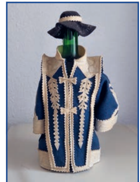
A képen a jászszenandrásai ajándék látható, a kalapba bele van hímelve a rendezvény helye és éve. Beküldendő a helyes évszám. 1992, 2002, 2012

Sok sikert a játékhoz, a megfjéjtéshez! Kép és szöveg: Tóth Tibor