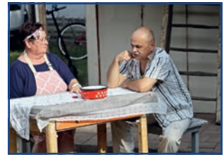
Jelenet egy házasságból – ősbemutató

tanárképzőbe jár, Nelli filmrendezőnek készül. Hazai és világlágereket, örökzöldeket énekeltek, sok esetben a közösséggel együtt. Rögtön egy duettel kezdtek, a 220 felett című Neoton Família slágerrel adták meg a kezdő hangulatot, ezt még tovább tudták fokozni ABBA sláger egyveleggel. Elhangzott több Hungária, Kovács Kati, Cserhát