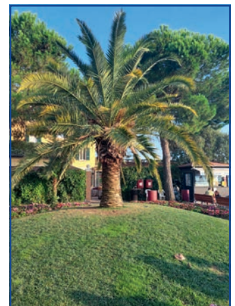
Simione tópartján egy pálmafa

Némi csúszásba voltunk a főút melletti piac miatt, ami több kilométeren át tartó kirakodóvásárt jelentett, és szinte (folytatás a 14. oldalon)