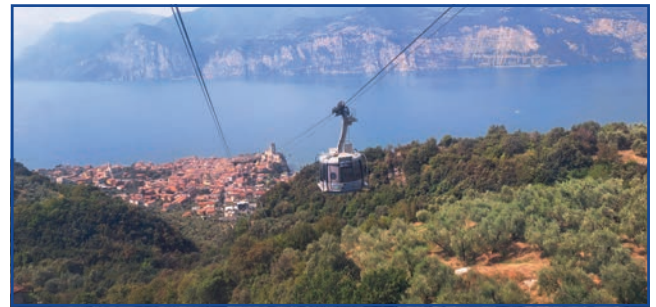
Malcesine – a felvonó első szakaszán közlekedő 35 személyes kabin

Tovább utaztunk Malcesinébe. Monte Baldo az olasz Alpok egyik hegysége, amely a Garda-tó partján emelkedik meredeken felfelé, legmagasabb pontja 2218 méter. A Monte Baldo felvonó Malcesine városából viszi fel a hegycsúcsra a látogatókat. Az egyedi felvonó segítségével a hegy egyik – 1760 méter feletti – csúcsára lehet jutni, ahol páratlan kilátásban gyönyörködhetünk.