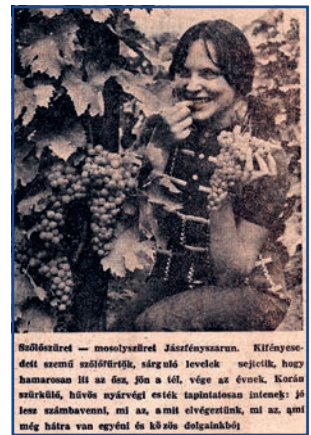
A Szövetkezeti Híradóban leközlött kép