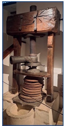
Bardolino – Olívaolaj Múzeumban

Az itt található Olívaolaj Múzeum 1987-ben nyílt meg, és egyedüli a világon, amely bemutatja és megismerteti a látogatókkal az olívaolaj gyártásának folyamatát. Itt láttunk egy vízimalmot, egy kőrömlalmot és más olyan szerszámokat, melyeket az évek folyamán az olívaolaj előállítás során használtak. Különböző ízesítésű olívaolajat kenyérekre csepegtetve kóstolhattunk meg, és borkóstolóra is nyílt lehetőség. A múzeum boltjában vásárlásra is volt lehetőség.