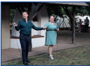
Egy duett után

Huszedikán délután 3 órára már többen érkeztek a Kiss József Helytörténeli Gyűjtemény udvarába, ahol kellemes kenyérrillat fogadta az érkezőket. A hivatalos program 16 órakor kezdődött, addig már folyt a kóstolás az új kenyérből, és beszélgetésre is jutott idő. Gyorsan megtelt a közösségi színel környéke. A kárpátaljai 21 fős delegáció is megérkezett.