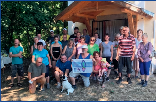
A jászberényi és jászfényszarui zarándokok a kerekudvari Gosztonyi kápolnánál

2024. augusztus 10-én a teljes Mária Úton nyitva állt a lehetőség, hogy útnak induljunk. Elinduljunk egy közös célért, így Jászfényszaru Egyházközsége is újra hívta a zarándokokat, hogy kerékpárral és gyalogosan induljanak az útra.