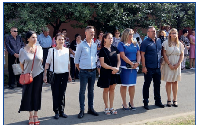
A Kiss család koszorúz és tisztel az emléktábla előtt