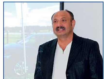
Farkas Lajos RNO elnök

Jelezte a jelenlévőknek, hogy az ORÖ több nagyszabású programot is elindított, amely további együttműködés lehetőségét vetíti előre a település és az itt élő szegény emberek számára. Ilyen például a téli közfoglalkoztatási program, amely keretein belül Jász-Nagykun-Szolnok megyében is több ezer fő foglalkoztatása és képzése valósulhat meg. Kijelentette, hogy minden eszközzel támogatja majd a program megvalósulását, és segíti az egyéb programokkal történő szinergia megerősítését.