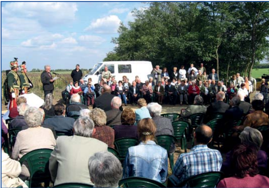
A Vasút-tanyai emlékhely