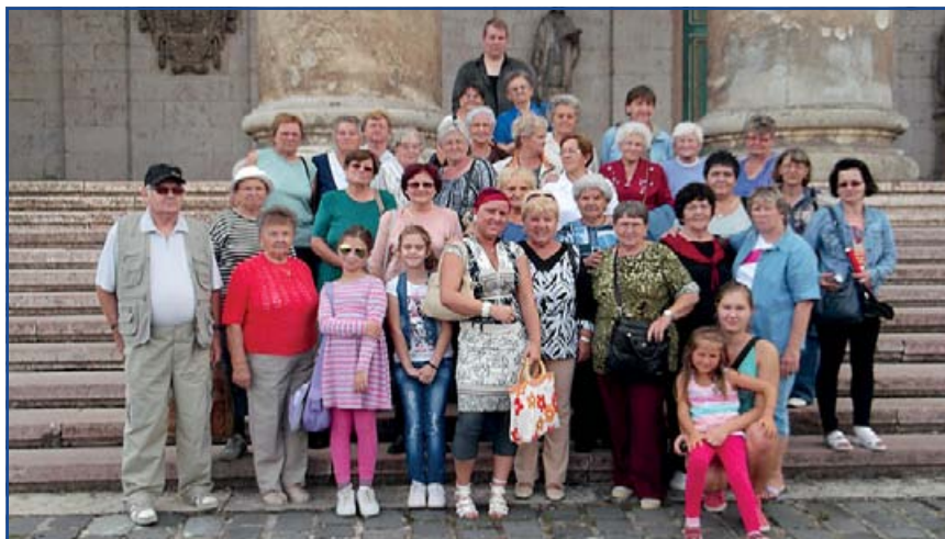
Esztergomba kirándult a nyugdíjas klub augusztus 29-én. Bár az eső nem engedte a dobogókői látványosságok megtekintését, mégis szép élményekkel tértek