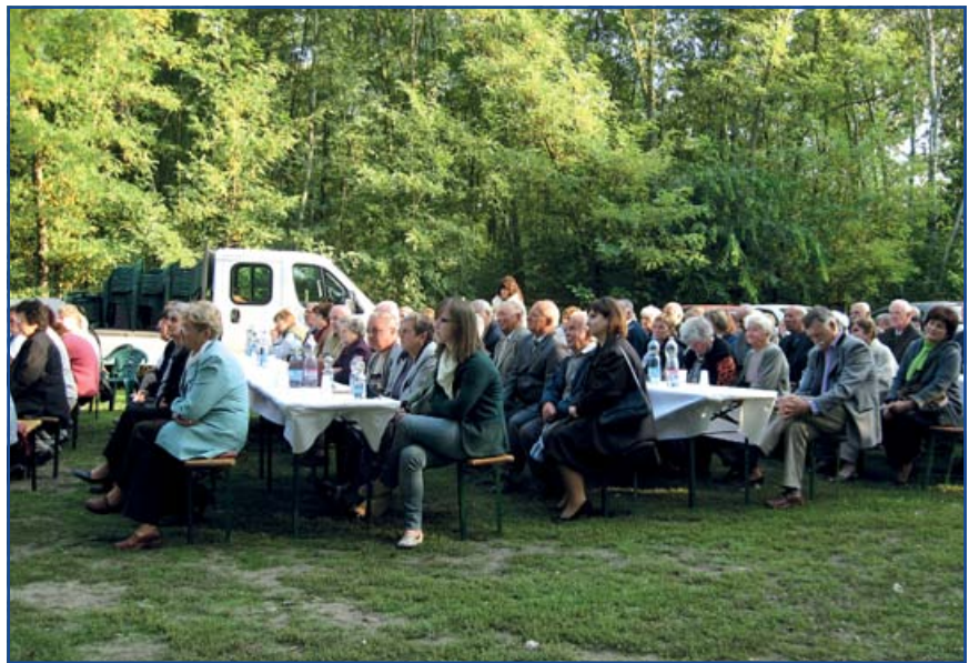
A Homok-tanyai iskolánál