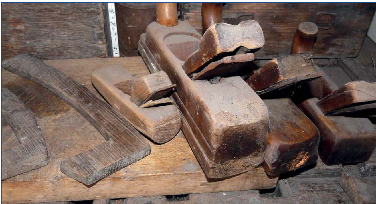
Por lepi az egykor sokat látott szerszámokat

A tudásom továbbadni sajnos nem tudtam, a következő generációból nem volt jelentkező, aki szívesen betanult volna.