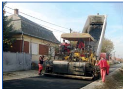
Aszfaltozás a Széchenyi utcában.