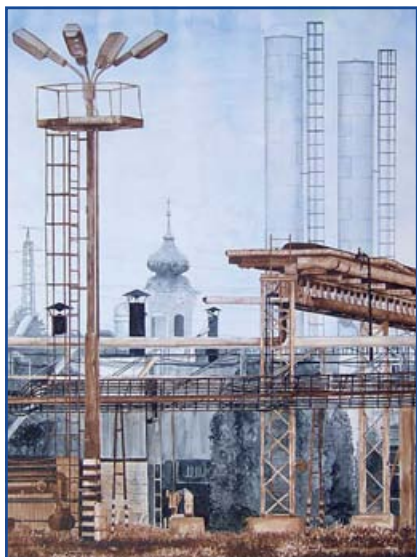
Kontraszt – Bugyi István munkája