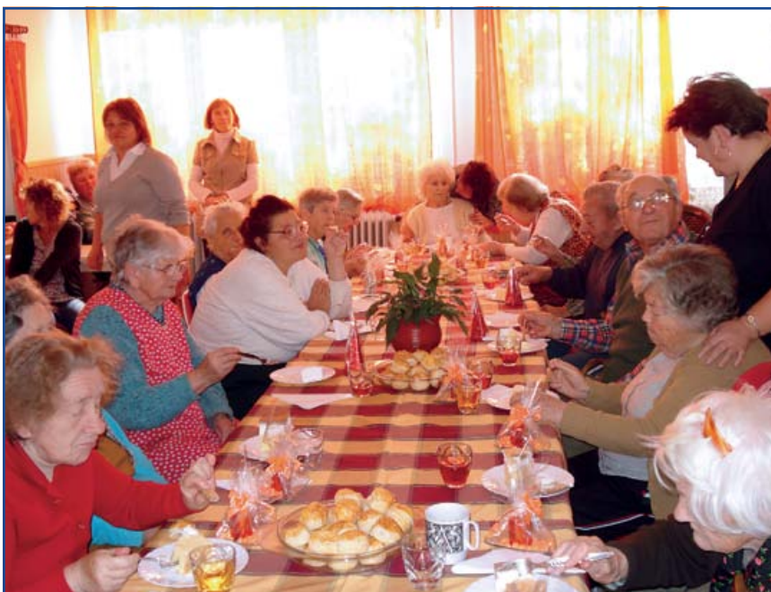
Lakóink nincsenek egyedül a hétköznapokban, mindig van egy segítőkész kéz számukra

Édességekkel (süteménnyel, pogácsával, üdítővel, stb...) és saját kezűleg készített ajándékkal kedveskedtünk az időseknek. A megemlékezést zenével és közös énekléssel zártuk, ami a megható pillanatok után vidám hangulatot hozott.