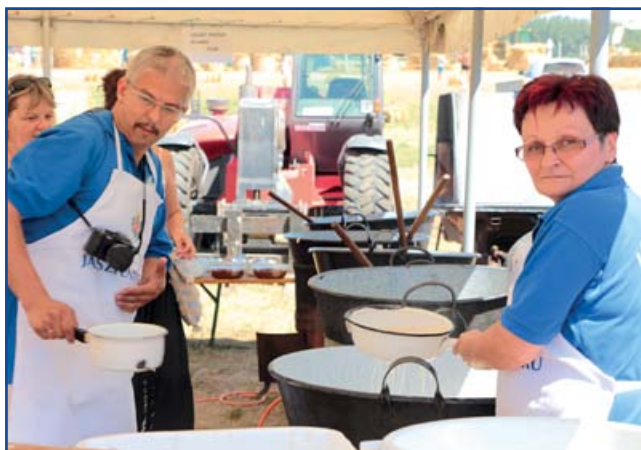
Fő az ebéd