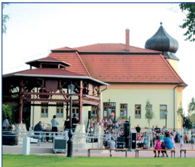
A Rimóczi kastély a zenepavilonnal

Az elutasított „Solar Park” néven ismert, napenergia alapú villamos energia termelésre és hasznosításra irányuló pályázatunk benyújtására ismét megnyílt a lehetőség a 2013. január 18-án megjelent KEOP-2012-4.10.0/C jelű konstrukció keretében.