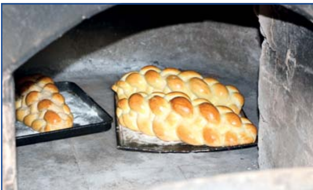
Fonott kalács is sült a kemencében.

Az ünnepség kezdetére már a második dagasztás három szépen megsült kenyerét vették ki a kemencéből, és némi ráfűtés után újabb három kenyérnek való került a kemencébe. Ezen műveleteket már a látogatók is megnézhatték.