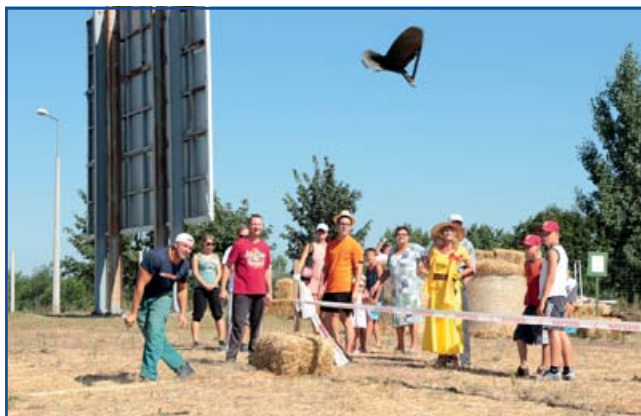
Messzire száll az ekefej.