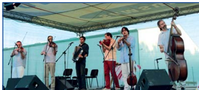
Buda Folk Band

Köszönet érte minden együttműködő partnernek!