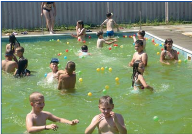
Nekünk a tanmedence a Riviéra!