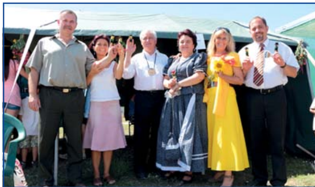
Vendégek a tarlófesztiválon

Idén már 6. alkalommal rendezte meg városunk a Tarlófesztivált, amelyre városnéző kisvonattal, kerékpárral, autóval kilátogatott városunk apraja-nagyja. A hagyományos Tarló hétpróba versenyen 12 csapat mérte össze ügyességét, kreativitását. A helyiek mellett az összetett versenyben ismét győztes Jászkarajenő (102 pont), Pusztamonostor, Jászboldogháza, a budapesti Műegyetem és idén először Kiskunfélegyháza (99 pont) csapata is ringbe szállt, ez utóbbi mindjárt meg is szerezte a 2. helyezést. A megújult tűzoltó egyesület két csapattal is képviseltette magát, de itt voltak a focisták és a Jász íjászok is. Az utóbbiak 1 ponttal csúsztak le a második helyről! A két gyermek csapat sem restelkedhetett az elért eredményével. A zsűri – melynek elnöke az idén az első tarlófesztiválok fő szervezője, Tóth Tibor volt – véleménye alapján a bálépítésben 53 ponttal a jászboldogházaiak bizonyultak a legjobbnak, de csak egy ponttal maradtak le mögöttük a Jász íjászok. Összességében elmondhatjuk, hogy kiélezett vetélkedőnek lehettünk tanúi augusztus 3-án.