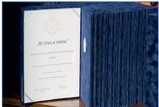
Az érem köntöse.

Jászfényszaru és a jászok hálatelt szívvel emlékeznek a magyar királyra, IV. Bélára, aki a keresztény haza és népeinek védelme érdekében szövetséget kínált és kötött egykori eleinkkel, akiket szabadságjogokkal felruházva – a kunokkal együtt – integrált a magyarok országába.