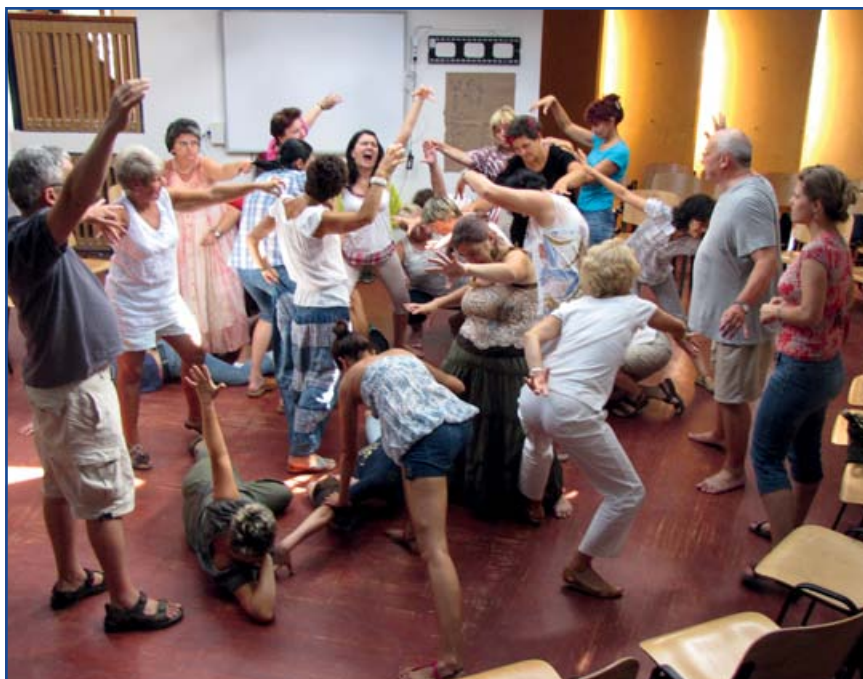
Foglalkozás I.

A konferenciát a SZIBAKÖ egyesület tagjai és segítői önkéntes munkája nélkül nem lehetett volna megvalósítani, amit ezúton is hálásan köszönünk.