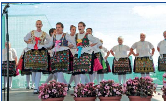
Színpadon a szomszédok...