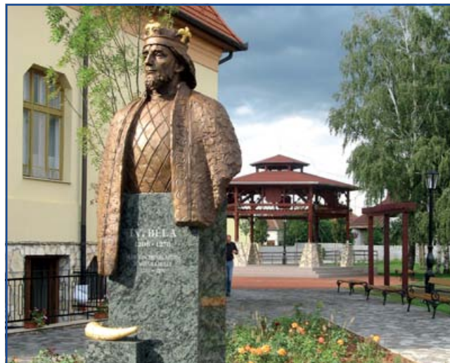
IV. Béla király szobra

IV. Béla király portrészobrát a jászok betelepülésének 770. évfordulója kapcsán állíttatja az Önkormányzat, a jász-kun együttélés értékeinek szimbólumaként, mely a legenda szerint Jászfényszarun fellelt Lehel kürtje mellett a jász identitást és a jászok-kunok kapcsolatát erősíti. Az emlékhely létrehozásával kaput kívánunk nyitni a jász-kun közös