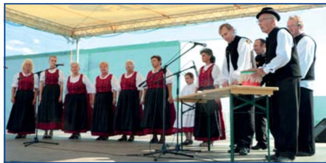
Fehér Akác Népdalkör

Számomra az volt a legnagyobb örömmel, hogy mindenki első szóra segít, sőt, felkínálta munkáját, termékét, saját szívügyének tekintette a fesztivál sikerét. Hiszem, hogy ez a nagyszerű összefogás és a segítő szándékú hozzáállás a titka és záloga kisvárosunk fejlődésének, az emberi közösségek megerősödésének, amivel – divatos szóval élve – élhető vidéki életet teremtünk mi, magunknak!