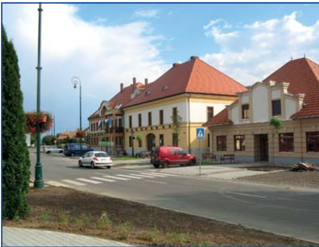
A Polgármesteri Hivatal és a GAMESZ épületei

Jászfényszaru Város Önkormányzata sok éve igyekszik minél több EU és hazai forrást elnyerni a település fejlődése érdekében. A város gazdasági környezete adta lehetőségek és ezáltal a pályázati lehetőségek maximális kihasználtságával nő a fejlesztések mérete, száma, javul a minősége. A források elnyerése eredményeként sok projektet megvalósítottunk.