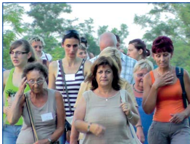
Irány a Lehel-tó!

ségformálást végezni. Nemzetközileg elismert és kiváló előadók, trénerek segítségével megismerkedhettek a nemzetközi gyakorlattal és a hazai tapasztalatokkal egyaránt.