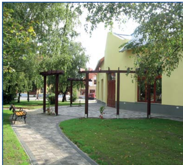
A Régi Kaszinó megújult épülete a park felől szemlélve