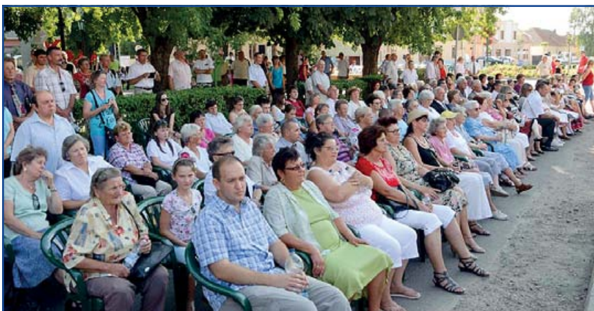
Nagyszámban volt jelen a város apraja-nagyja.

A képviselő úr után dr. Kállai Mária kormány megbízott köszöntötte az ünneplőket, aki beszédében hangsúlyosan szólt az összefogás erejéről: (folytatás a 2. oldalon)