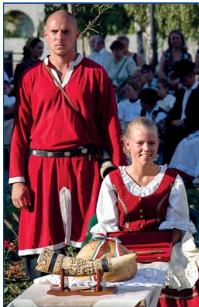
Hűszévesek.