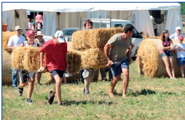
Nem szégyen a futás...