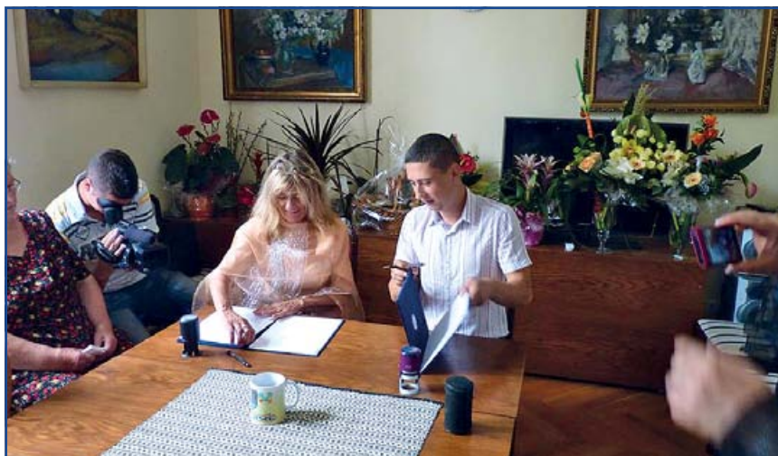
Jászfényszaru és Gát község közötti együttműködési megállapodás aláírása.

az újkenyeret. A szentmisét követően a Rimóczi-kastélyban testvér települési szerződés megkötésére került sor Gát és Jászfényszaru városa között. A testvérvárosi együttműködés