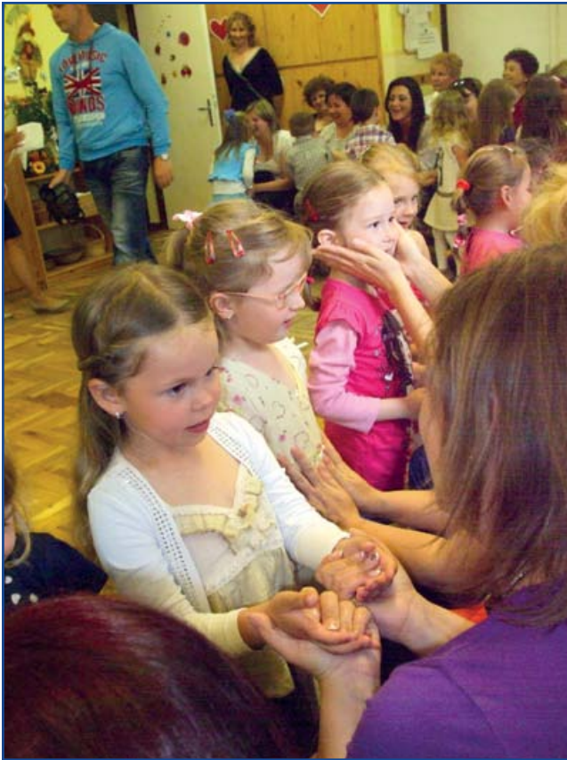
Fotó: Földvári Edit