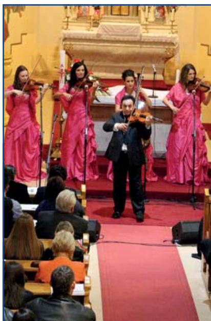
A nagyszerű koncert egy pillanata a fényszarui templomban.