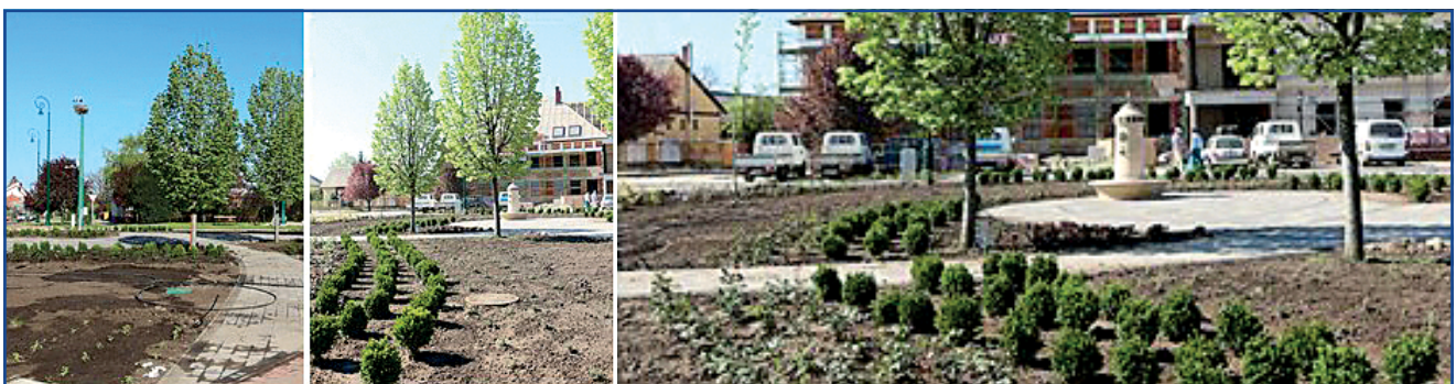
Befejezéshez közeledik a főtér parkosítása.

A projekt az Európai Unió támogatásával, az Európai Regionális Fejlesztési Alap társfinanszírozásával valósul meg.