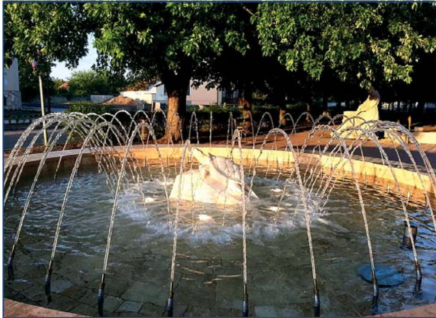
Máris nagy népszerűségnek örvend az új szökőkút.