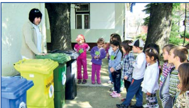
Fotó: Pető Petra

Ma már szinte valamennyi hazai oktatási intézmény – az óvodától az egyetemig – rendkívül fontosnak tartja a környezetvédelmet, azon belül is Földünk megővését. Óvodapedagógusaink a szülők és gyermekek segítségével a Föld napja alkalmából a hagyományoknak megfelelő módon próbálták felhívni a figyelmet földi értékeink megőrzésére. Egész napos programmal tették a gyermekek számára emlékeztetésé a Föld napját 2013. április 22-én a Napsugár Óvodában.