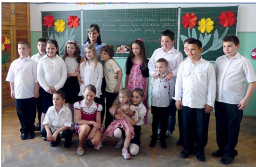
A 3. b osztály

kolózva köszöntő verseket, dalokat tanulnak, kedves meglepetéseket, ajándékokat készítenek, ám mindehhez a tanító nénik irányítása is szükséges. Ő állítja össze a műsort, kiosztja a szerepeket és próbálnak, amíg tökéletes nem lesz. A műsor teljesen tökéletesre sikerült, minden tanuló tudta a szerepét. A fiúk verset mondtak, énekeltek. A lányok május virágainak szerepében köszöntötték az édesanyákat. Minden virág, minden kedves szó kevés azért cserébe, amit egy édesanya tesz a gyermekéért. Hála, szeretet, köszönet – ez a három szó volt az ünnep üzenete. Anyák napja csak egyszer van egy évben, de az év minden napja kevés lenne hálánk lerovására. Köszönet a tanító nénik kitaláló közreműködéséért!