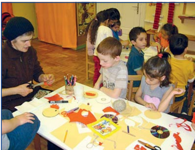
Készülnek a kicsibék használt CD lemezekből