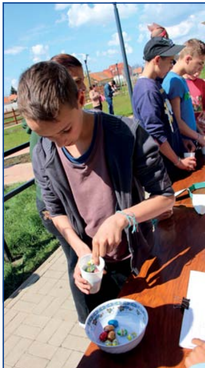
Pillanatkép a húsvéti tojáskeresőversenyről a Szent József Szabadidőparkban.

Elfogadták a funkcióbővítő város-rehabilitációs projekthez kapcsolódó konzorciumi partnerségen alapuló finanszírozás érdekében szükséges fedezet és biztosítékok nyújtására vonatkozó támogatási feltételeket a Cserháti és Társa Kft. részére.