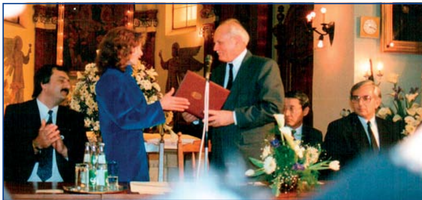
1993 – A városalapító okirat átadása.