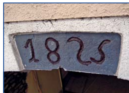
A főbejárat feletti 1825-ös évszám

Az építkezés 1825-ben rendben megkezdődött. Erre az időpontra utal a főbejárat feletti