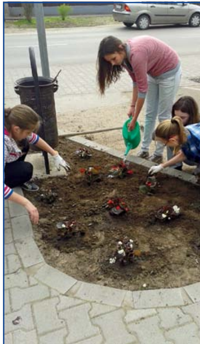
Virágültetés a Nagyiskola körül.

A Képviselő-testület felhatalmazta a Polgármestert, hogy a 2012. október 16. napján az önkormányzat és a megyei kormányhivatal között kötött, a Jászberényi Járási Hivatal kialakításáról szóló megállapodás 1. számú mellékletét a Jászberényi Járási Hivatal helyi önkormányzatjainak Szabadság tér 18. szám alá történő áthelyezésével kapcsolatban megfelelően módosítsa , továbbá jóváhagyták a Városháza felújításához kapcsolódó költöztetés költségeit.