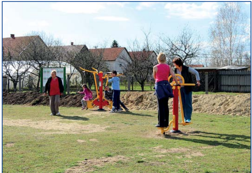
Felnőtteknek is! Atadták a fitness parkot.

Döntöttek arról, hogy támogatják a Jászfényszaru Városi Sport Egyesület az MLSZ TAO programjában meghirdetett pályázatát az önrész biztosításával, azaz