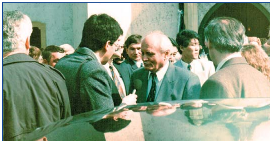
Az ünnepség végén a templom előtt Göncz Árpád köztársasági elnök villáminterjút ad a Magyar Rádióknak

Göncz Árpád ünnepi beszédének végéből idézve ma is aktuálisak gondolatai: „Boldogulásunk forrása csak a jól végzett munka lehet, és az egymás iránti türelem. Mert nem az a demokrata vagy jó hazafi, aki túl tudja ordítani a másikat, hanem aki tisztelettel vesz tudomást a másik emberről, annak eltérő nézeteiről, és a közös érdekében megegyezésre törekszik, miként Önök, legalábbis az esetek