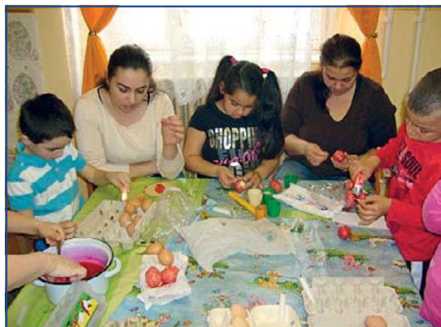
Szaporodnak a piros tojások

Dné Kati · Fotók: Földvári Dorottya, Kovácsné Papp A.