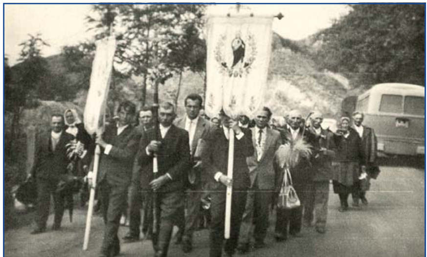
Szentkút – régen