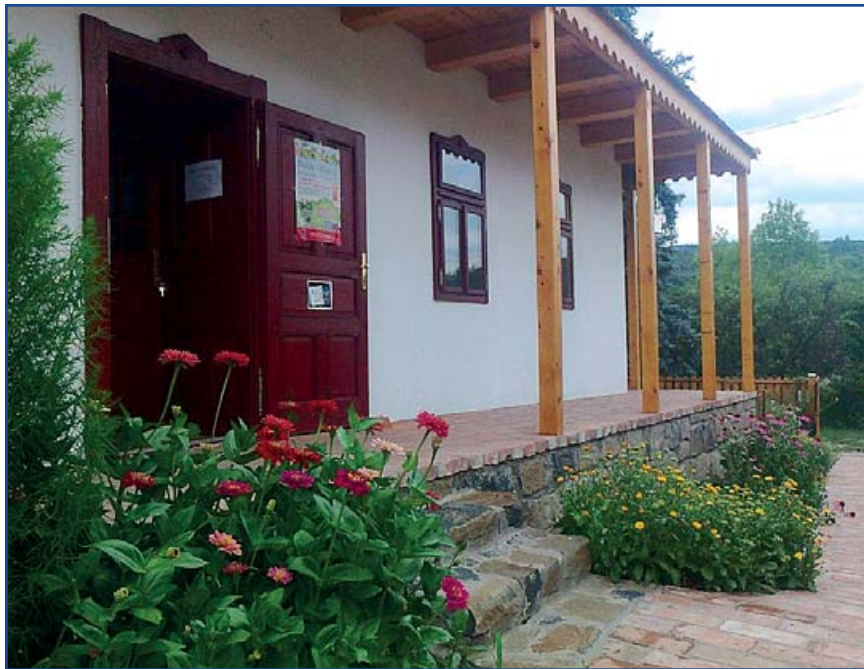
A Hunnia Csipkemúzeum bejárata Terényben.