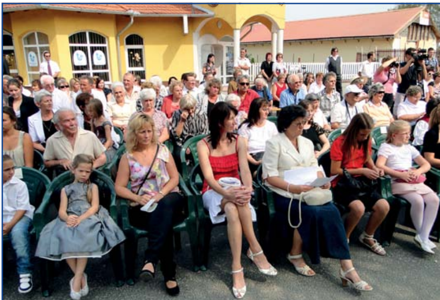
Az ünnepség résztvevőinek egy csoportja

rúgott meg, amit különösen azután tartok nagy eredménynek, hogy amikor tanárként néha beálltam a felső tagozatosok közé focizni, nagyon kellett figyelnem arra, hogy ne okozzak sérülést. A tanórákon ügyelt a tananyag elsajátítására. Megértő, türelmes volt, de ha elégedetlen volt velünk, akkor elmaradt a foci. Ilyen eset volt például környezetismeretből Szolnok város jellemzése. Aztán, számunkra váratlanul, behívták katonának, amit mi gyerekek sehogy sem értettünk. Felső tagozatban egyik kedvenc tantárgyunk volt a gyakorlati foglalkozás,