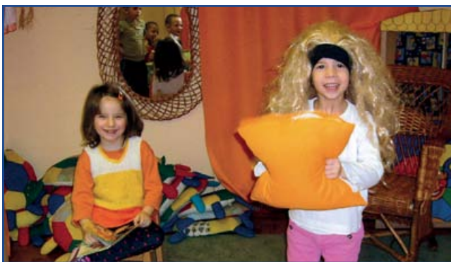
A Holle anyó című mese dramatizálása