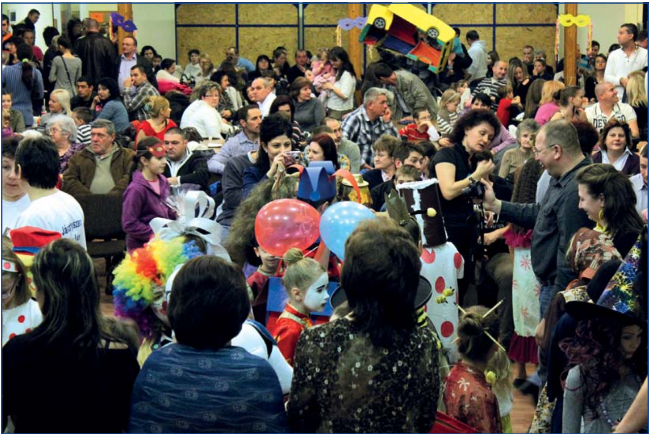
A maszkabáli forgatag ugyanaz és mégis más

...jó értelemben persze, 2013. évének jégbontó havában, az első szombati napon. Az alsó tagozatos osztályok ekkor rendezték maszkabáljukat a művelődési házban.