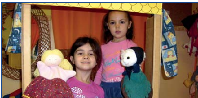
„Mintha” játék bábokkal

A szerepjáték fejlődésének különböző szintjei vannak. Kisóvodás korban a manipuláció okozza a fő örömet a szerepjátékban a gyermekeknek. Szeretné a felnőtt életét utánozni, ezért ezt főzőcske közben például edények kipakolásával, almareszeléssel, tésztagyúrással teszi. Maga a tevékenykedés számára sokkal fontosabb a szerepnél, illetve a történésnél. A 4-5 éveseknél már a szerepjátékban nem a manipuláció fontosságáé a fő szerep, hanem a közben használt tárgyak sugallják a játékot. Ezért a szerepeket a játék közben használt tárgyak sugallják számukra. Tehát aki kezében a „hallgató” van, ő az orvos; aki pedig köténykében van, ő a pincér stb. Csak ezen a fokon jöhet létre az a lehetőség, hogy egy autót egyszerre két sofőr is vezet, az ebédet egyszerre több anya főzi. A nagy óvodások szerepjátékában már a szerep iránti érdeklődés a fő jellegzetesség. Például csak akkor lehet valaki orvos, ha vannak betegei is, vagy akkor lehet pincér, ha vannak vendégek az étteremben. A szerepeknek megvannak a sémáik, viselkedési rituálék, amikhez a játékban részt vevő gyermekek szerepük játsszása közben ragaszkodnak. (Például csak az ebéd megfőzése után ebédelhetnek.) Ebben az életkorban a gyermekek szívesen játsszák el az óvodában