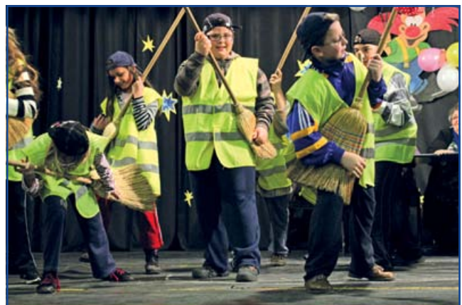
Ha akarom gitár...