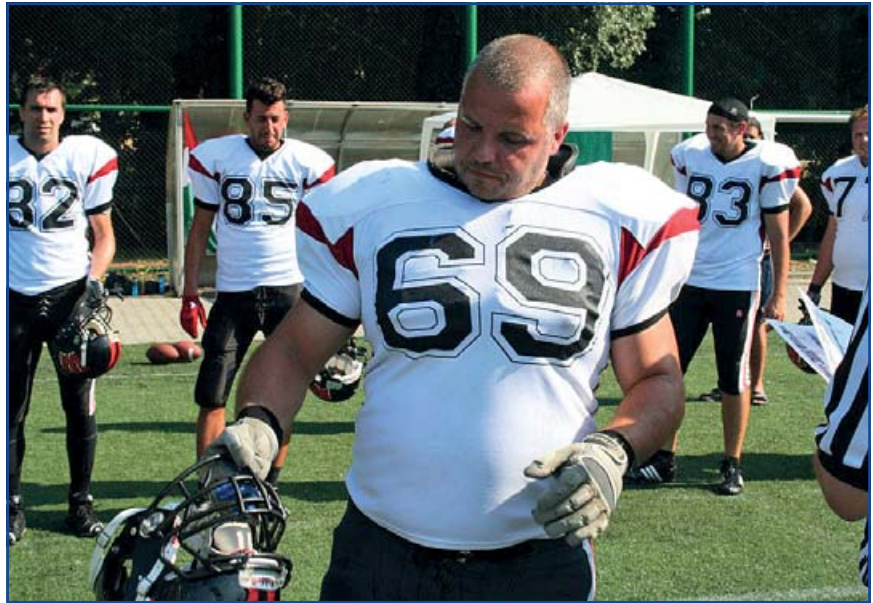
A csapatársakkal a mérkőzés előtti percekben

találkozó alkalmával pár barátom említette, hogy Pesten alakult egy amerikai football csapat, FARKASOK néven. Miért nem megyek le, nekem biztos menne, hisz előtte 12 évig atletizáltam, az alkatom megvan. Kalapácsvető voltam, és az ifi válogatottságig jutottam. Bár jászfényszaru gyerek vagyok, de akkor még Pesten laktam. Tetszett a megélegetett bizalom, no meg a játék is szim-