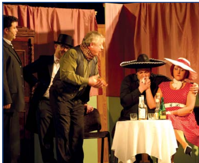
A magyar kultúra napja alkalmából január 19-én a Fényszaruiak Baráti Egyesülete szervezésében a jászárokszállási Görbe János Színháztársulat nagy sikerrel mutatta be Kállai-Fényes-G. Dénes: Majd a papa című három felvonásos zenés vígjátékát.

Sokan irigylik Jászfényszarut a sok színes programért, a gazdag civil életért, a jó körülményekért. Hogy ki hogyan él ezekkel a lehetőségekkel, a saját dolga és felelősége. Ne várjuk mástól a megoldásokat! S ha nem megy egyedül, keressünk segítőt, társakat! A jászfényszarui közösségi, kulturális élet minősége csakis rajtunk, fényszarui polgáro-