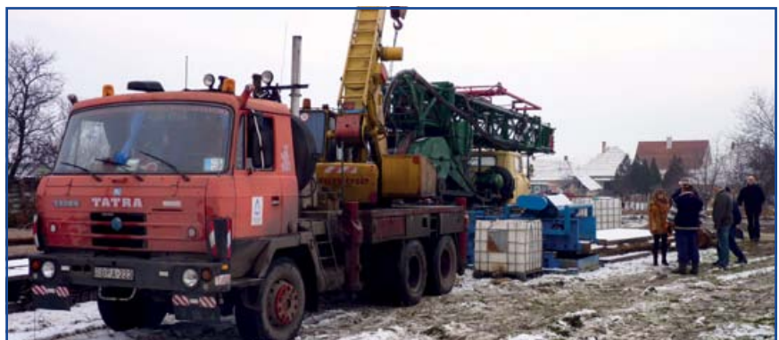
Fotó: Kubala Zsolt

A Polgármesteri Hivatal, a Városgondnokság és a Régi Kaszinó Étterem fűtését megújuló energia hasznosításával oldjuk meg. A feltárt geotermikus energiaforrást más, nem önkormányzati intézmények, mint a templom épülete és a városközpontban található üzletház szintén hasznosíthatják. A feltárás másodlagos célja a vízminőségtől függően ivóvíz szolgáltatás bővítés vagy más beruházás megvalósítása is lehet.