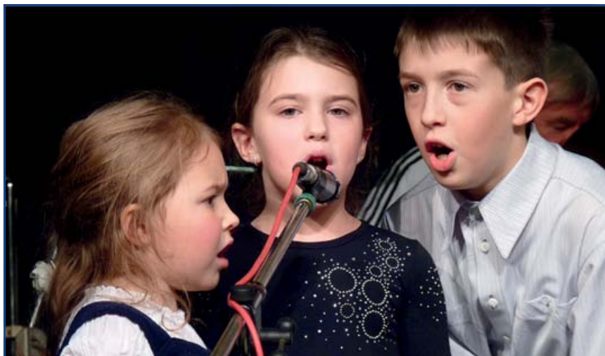
A meglepetés vendégek a kavalkád műsorában karácsonyi dalokat adtak elő.