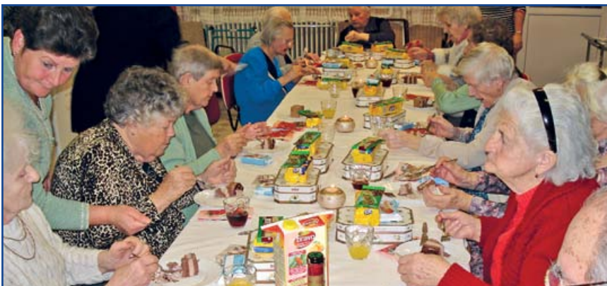
Karácsony az Idősek Otthonában.

A karácsony közeledtével az iskolákban, óvodákban, munkahelyeken is megkezdődtek az ünnepi készülődések. Nem volt ez másképpen az Idősek Otthonában lakó időseink életében sem. Ebben az intézmény dolgozóin kívül többen segítségünkre voltak. Ezúton szeretnénk megköszönni az ajándékokat, az ünnepi vacsorát, a karácsonyi műsorokat, összejöveteleket. Köszönettel tartozunk az Önkormányzatnak, a SAMSUNG-nak, az iskolásoknak, óvodásoknak, Kiss Gábor érseki tanácsos plébánosnak, az Igekörnek, és mindenkinek, aki gondolt ránk ebben a szép időszakban. Boldog új évet kívánunk mindenkinek!