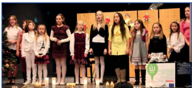
A zeneiskolások karácsonyi hangversenye.