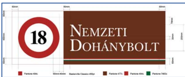
Egységes színű és formakódú felirat a dohányboltok megkülönböztetésére

A köztudatban trafiktvörényként rögzült, a fiatalok dohányzásának visszaszorításáról és a dohánytermékek kiskereskedelméről szóló 2012. évi CXXXIV. törvény jelentős változásokat hoz a dohánytermékek árusításával kapcsolatban 2013. július 1. napját követően. A jogszabály értelmében ezen termékeket ugyanis – néhány kivétellel – kizárólag külön dohányboltban lehet majd értékesíteni, egy ilyen üzlet nyitását pedig pályázati eljárás elnyerésétől teszi az állam függővé. A nemzeti dohánybolt elnevezésű trafikok számát a jogalkotó településünkön háromban határozta meg, ezeken kívül dohánytermékeket szórakozóhelyen, üzemanyagtöltő állomáson, újságarusnál, vagy más helyen tilos lesz árusítani.