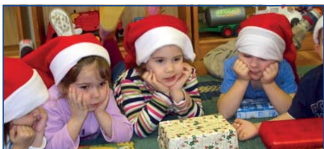
A Szivárvány Óvoda karácsonyi manói.