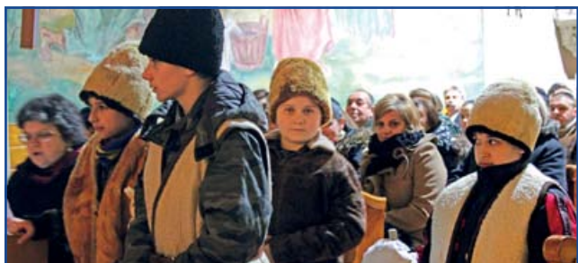
Pásztorjáték a templomban.