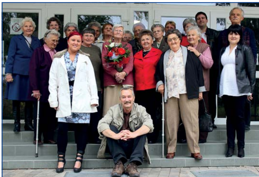
Együtt ünnepelték a harmincéves jubileumot a nyugdíjas klub tagjai, a foglalkozásoknak helyet adó Petőfi Művelődési Ház dolgozói és az ünnepi műsort adó Pécsi Vígágtévők.