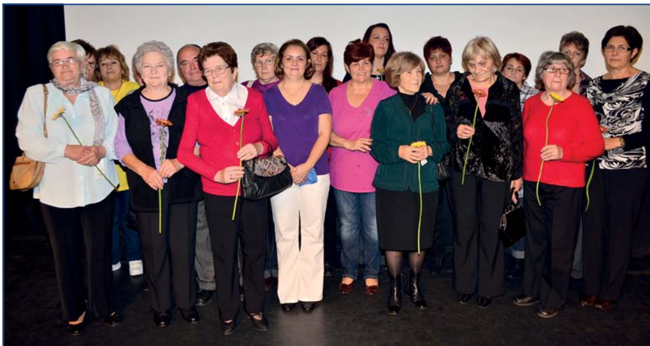
A két óvoda aktív és nyugdíjas dolgozói

Óvodánk jelenleg is négy csoporttal működik, nyolc óvónő és négy dajka kíséri óvodába lépéstől az iskolakezdésig a gyermekeket.