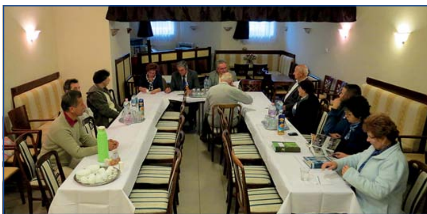
Tanácskozik az elnökség