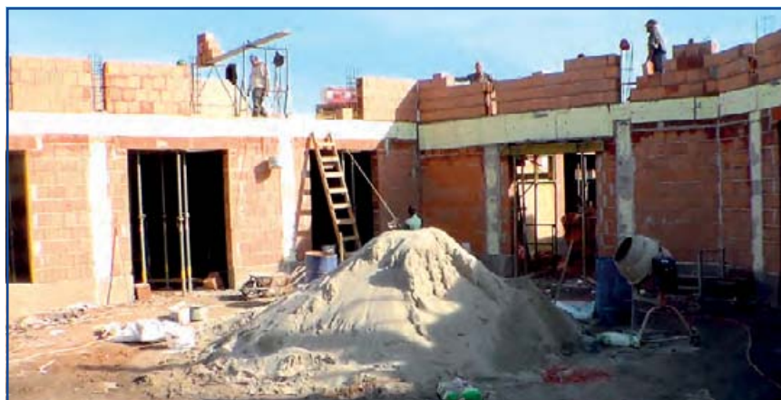
A Pedagógusház helyén üzletközpont épül.

mi egységeknek nyújt helyet, mint például ruházati üzletek, szépség szalon. A projekt keretén belül megtörténik a Régi Kaszinó Vendéglő és a Cserháti Diszkont megújítása és bővítése. A Kaszinó esetében is módosultak a tervek, de az átalakítást és a végső határidőt ez nem hátráltatja. A munkálatok a Cserháti Diszkontnál is folyamatosan zajlanak, az üzlet a felújítás ellenére nyitva tart, mindössze néhány hétre kell átmenetileg bezárni, annak érdekében, hogy az építkezés ez év december végéig befejeződhessen.