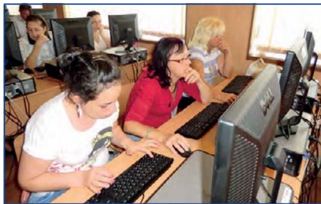
Számítástechnikai oktatás az alkalmazott informatikai laborban

Az „Első lépések Jászfényszarun” projekt harmadik félévében is további közösségi rendezvények, tanulás–tréning, tanácsadások várnak a programban lévőkre. A projekt végéhez közeledve a képzés modulban számítástechnikai alapismeretek oktatására került sor Jászberényben a Terplán Zénó Műszaki és Közgazdasági Szakképző Iskola EDU–RÉGIÓ Nonprofit Kft. szakképző központjában, alkalmazott informatikai laborban (a Monostori út 4. sz. alatt), ahová a képző intézmény a hallgatókat külön autóbusszal szállította.