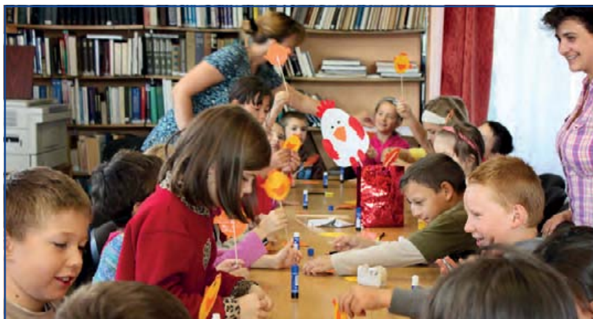
Így készülnek a csibék

Október első hetében ünnepelték A magyar népmese hetét a Városi Könyvtár és a Gyermekjóléti Szolgálat szervezésében a jászfényszarui Városi Könyvtárban. 2012-re már többéves hagyománya van a rendezvénynek, melyhez az idén a szükséges forrásokat a TÁMOP 3. 2. 4. A – 11/1 – 2012 – 0068 számú „A jövőben olvasunk? A jövőnek olvasunk! Az olvasóvá nevelés, az olvasáskultúra fejlesztésének hagyományos és új útjai.” című EU – s pályázat biztosította. Eddig csak egy-egy nap erejéig várták mesével és vidám feladatokkal a legkisebbeket, most egy egész hetet szenteltek nemcsak nekik,