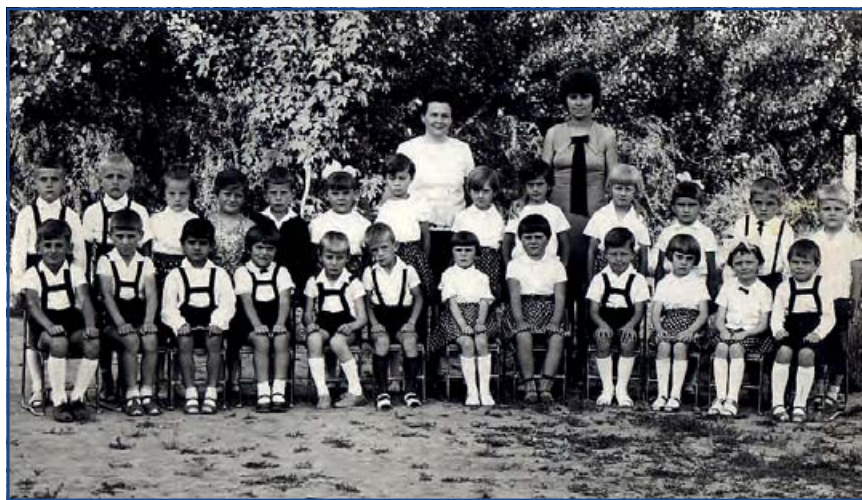
Egy régi fotó a „kinti” óvodából.

Milyen nehézségekkel, problémákkal kellett megküzdeni az évek során?