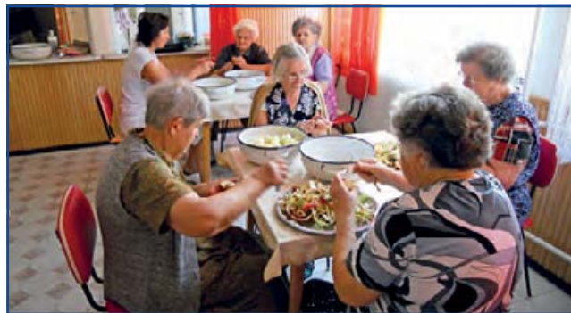
Készül a sütemény

Fél kg lisztet, 1 csomag sütőport, kevés sót és 20 dkg cukrot egy egész tojással, 15 dkg zsírral és 2 dl tejjel összekeverünk. Két részre osztjuk a tésztát. A tészta egyik felét zsírozott, lisztezett tepsibe terítjük. Legalább 2 kg almát elreszelünk és kinyomkodunk, majd a tészta tetejére terítjük. Az almatötelet megszózzuk vaníliás cukorral, törött fahéjjal. Tehetünk bele mazsolát is. A tészta másik felével az almát betakarjuk, tojás sárgájával megkenjük, majd villával megszurkáljuk. Forró sütőben világosbarnára sütjük. A kész tésztát vaníliás cukorral bőven meghintjük.