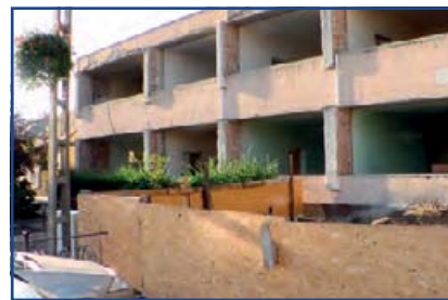
Felújítás alatt a Városháza

A zöldfelület automata öntözőrendszerrel lesz ellátva. Felújításra kerül még a templom körüli parkban megtalálható szökőkút és az itt található szobrok is. A templom