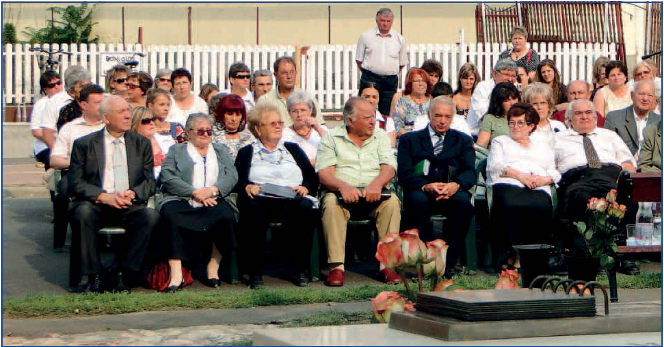
Az ünnepség résztvevőinek egy csoportja

Jászfényszaru Város Önkormányzata, a Fényszaruiai Baráti Egyesülete és a „Jászfényszaruért” Alapítvány meghívását a szeptember 1-jén délután 14 órakor kezdő bensőséges ünnepségre mintegy kétszázötven fő fogadta el. A Himnusz elhangzásával vette kezdetét a közel két órás program.