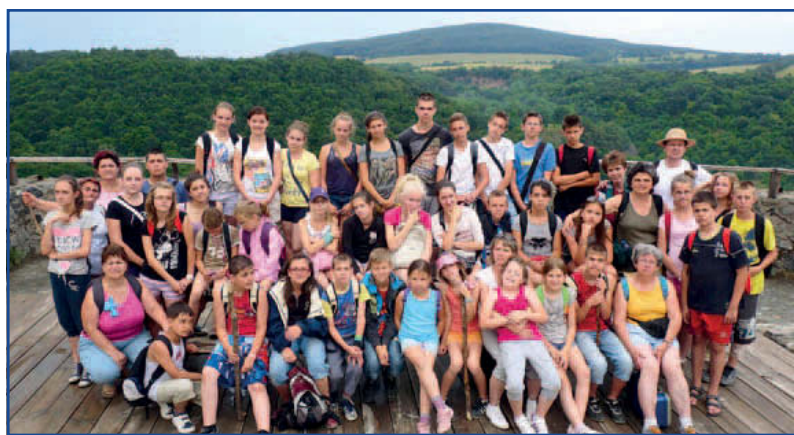
Várbódtók a vihar után Somoskőn.