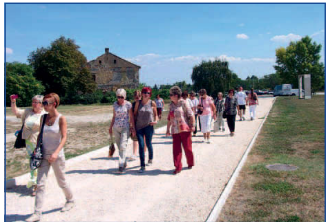
Megérkezés a komáromi Monostori Erődhez

szomorúfüzeteket. A kertben található a pálmaház, és egy francia építész, Charles Moreau nevéhez köthető műrom, mely egy háromhajós templom maradványait imitáló romantikus stílusban épült rom. Tata után Komáromba, a Monostori Erődbe vezetett az utunk. Az erődök a XIX. század legfejlettebb haditechnikai elvei alapján klasszicista stílusban épültek. Lenyűgöző látványt nyújtottak a gondosan faragott kővekből illesztett védfalak, bástyák, löporraktárak, kiképzőtermek,