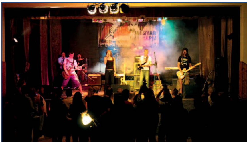
Alkalom adtán zenekar

Szóval kitekintünk és ellátunk mondjuk Boldogig. Ahogy arról a közmédia is beszámolt, szeptember 9-én volt a Magyar Dal Napja. És hogy jön ez össze Boldoggal? Úgy,