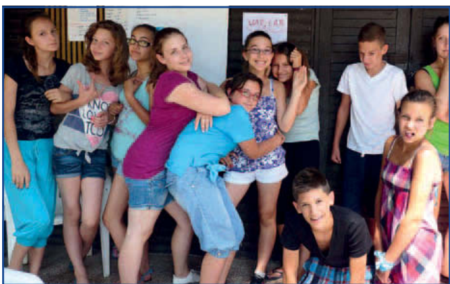
A „Mesekék” csoport drámajáték foglalkozásának egy pillanatában készült a „családi tábló”.