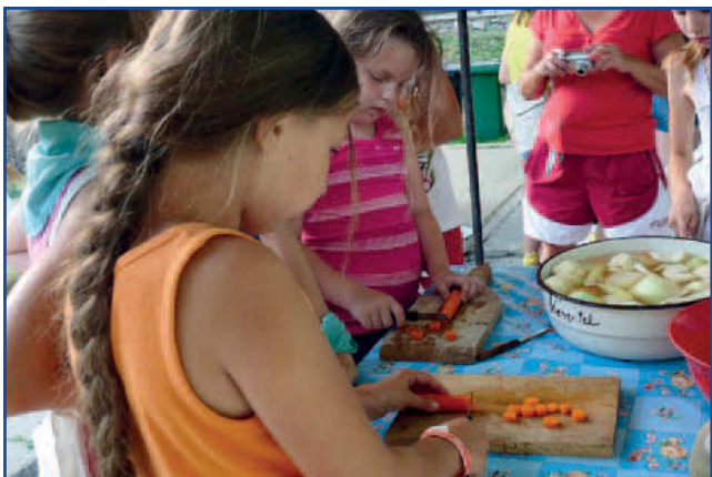
Készül a köleves alapanyaga.