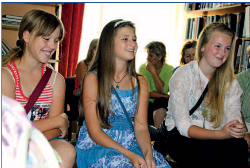
Boldogi általános iskolások élménybeszámolója

ráló napok), illetve valósított meg tanórán kívüli tevékenységeket iskolai szinten: sakk szakkör, háztartási szakkör, JAM szakkör, tábor, gyermeknap, sportnap, egészségnap, Állatok világnapja, felolvasó napok.