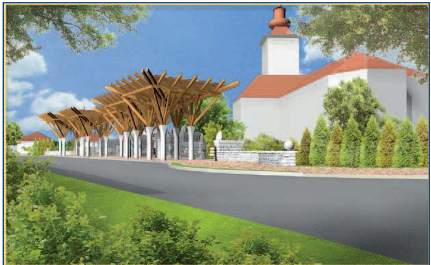
Látványterv a templom felől

2012 augusztusában elkezdtek építeni Jászfényszaru városban a templom melletti új buszmegálló épületét. A munkálatok egy jászsági projekt keretében készülnek: Közösségi közlekedés néven futó, a Jászság 11 települése részvételével zajló projekt egyik eleme egy modern buszmegálló építése Jászfényszarun.