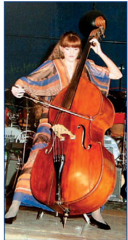
A Jászfényszarui Petőfi Művelődési Ház színpadán 1996. február 16-án a III. FÉBE bál műsorában nagybőgőn játszik.

2012. szeptember 26-án tisztelői, pályatársak, tanítványok búcsúztak tőle a jászfényszarui Alsó-temetőben, ahol örök nyugalomra helyezték.