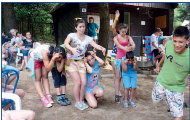
Izgalmas mesetalányokat fejtettünk meg a Szeretlek Meseország! vetélkedőn