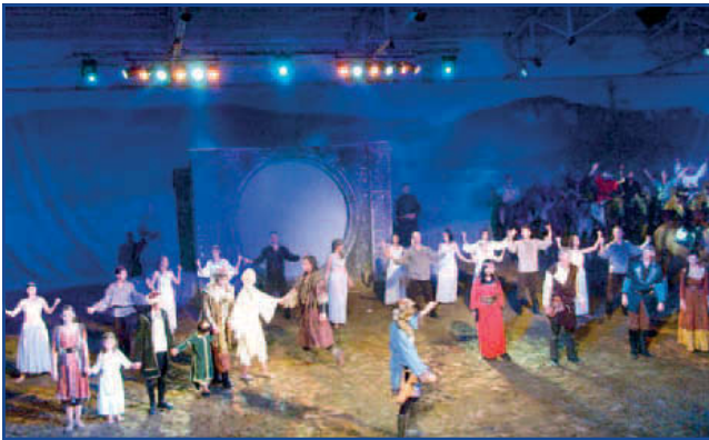
A Magyar Lovas Színházban a Honfoglalás című előadás egy pillanata