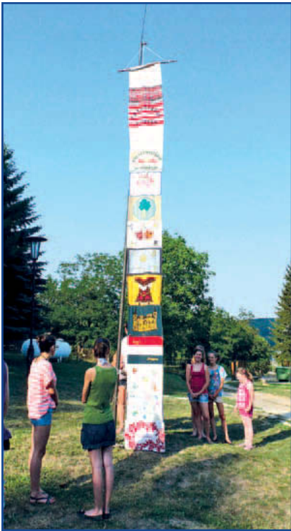
15 összevarrt zászlót lengetett a szél az idén Salgóbányán az Abonyi Ifjúsági Tábor festői környezetében.

Az általános iskola és BLNT Drámapedagógiai Műhelye táborának általános célja továbbra is a kommunikációs és a manuális készségek, a fantázia és a kreativitás fejlesztése, a környék kulturális és természeti értékeivel való ismerkedés, a természetvédelem tudatosítása és a környezettudatos magatartás fejlesztése volt.