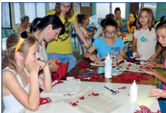
A filcrátétől a gyöngyig szinte mindennel díszítettük a tarisznyánkat.