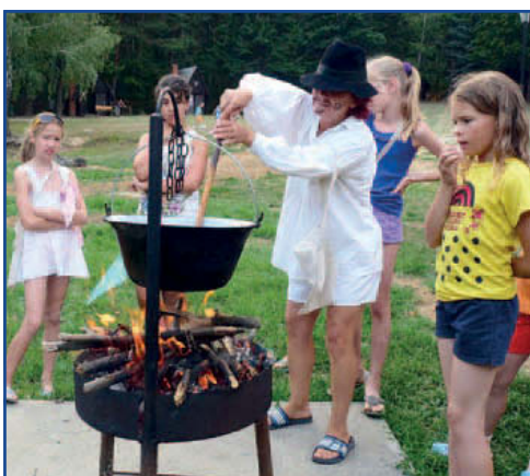
Bográcsban fő a Köleves. Vajon milyen lesz?