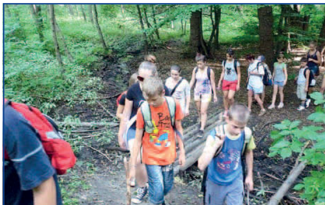
Mindenki szavát visszafogva figyelte a természet szépségeit a Csend-túrán