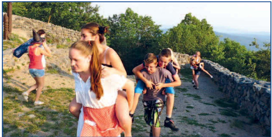
A várfoglalás vidám pillanatai Salgón.

A manuális foglalkozásokat is a mesékhez igazítottuk. Díszítettük az Alfa varroda segítségével elkészült tarisznyákat rátéttel, gyönggyel, hímzéssel, textilfilccel. Közösen készítettük a hamuban sült pogácsákat és eljátszottuk a Kőleves című mese szerint annak készítését, amelyet szintén minden táborlakó megkóstolt.