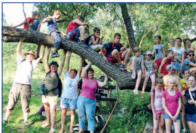
Nehéz ennyi gyereket megtartani! (Útban a Somoskői vár felé.)