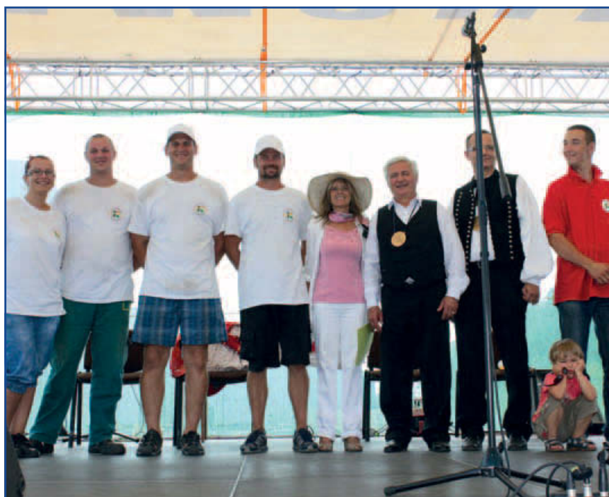
Győztek – Pusztamonotor csapata nyerte a Tarló hétpróbát