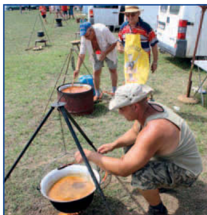
Aratóétel főzőhelyszín.