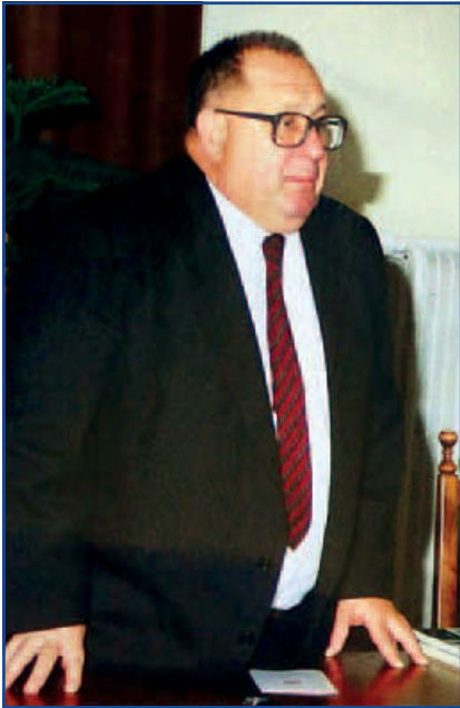
1994. október 8-án Jászfényszarun a Városháza dísztermében előadását tarja.

2012. július 25-én tisztelőinek sokasága, barátok, pályatársak, tanítványok búcsúztak tőle a szolnoki Kőrös úti temetőben, ahol a dízsírkertben helyezték örök nyugalomra.