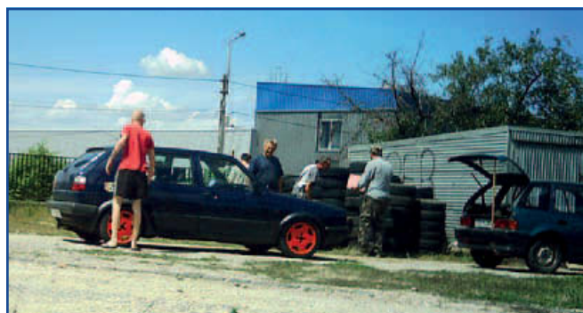
Használt gumiabroncsok gyűjtése

Kép és szöveg: Urbán Csaba Jászfényszaru Polgármesteri Hivatal