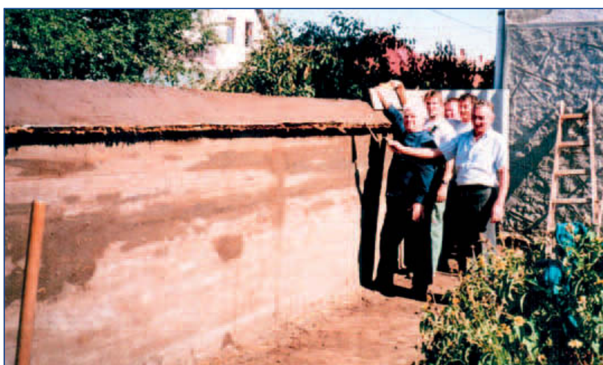
Elkészült a vertfalú kerítés 2000. szeptember 17-én, a munkálatokat Berze László irányította.

A léckerítés építéséhez általában nem hívtak mesterembert, hanem a család tagjai maguk végezték, rokoni, szomszédai segítséggel. Jó alkalma volt ez a közösen végzett