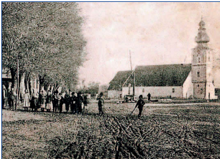
A jászfényzarui templomtorony az 1900-as évek elején, a villámcsapás előtt. A képeplap a Kiss József Helytörténeti Gyűjtemény tulajdona. Retusálta: Kubala Zsolt

tész tervei is készen voltak, de azokat 1913 februárjában módosították. Az építkezések nyomán 1913-ra a templomtorony magasabb és díszesebb lett, a toronysisak pedig új