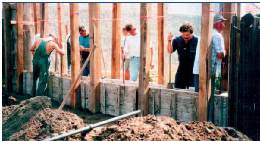
A Fényszaruiai Baráti Egyesülete szervezésében 2000. szeptember 10-én a Kiss József Helytörténeti Gyűjteménynél az utca frontra készül a vertfalú kerítés.

A léckerítéshez általában a bejárati ajtót és a kétszárnyú kaput is lécekből készítették. A léckerítés díszítését szolgálta, ha a tartógerendák végét különböző formára kifaragták. Erre a református Jászkiséren találtunk nagyon szép példát 1984-ben, amikor a kerítésen túlnyúló tartóoszlop végét a református fejfák mintájára, gombos végűre faragták ki.