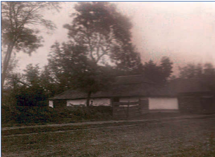
Farazatos istálló garádjával, Jászberény 1920-as évek.

A telek felkerítésére általános volt a Jász-ságban a tehéntrágyából vagy földből felhánt garádja, garággya is. Jászárokszállás 1799-es tanácsi jegyzőkönyvében a következőket olvashatjuk a garággya felrakásáról: „Panaszképpen bé jelentetett: Hogy némelly lakosok a garádjaikat újítván, közös földre, sött az utakra is kinyomják és úgy a járásokat szoríttyák, ezért is meghatározott: Hogy megvizsgálván az idén és tavaly ki rakott Garádgya helyeket, ahol a járást akadályoztattyák, vagy a járásban valamely szorulást okoznak, rakattassanak előbbeni helyekre, a hol pedig e nem volna, fel méretetvén a fel fogott hely, azoktul meg határozott Taxa vétessen.” A garádjákat használ-