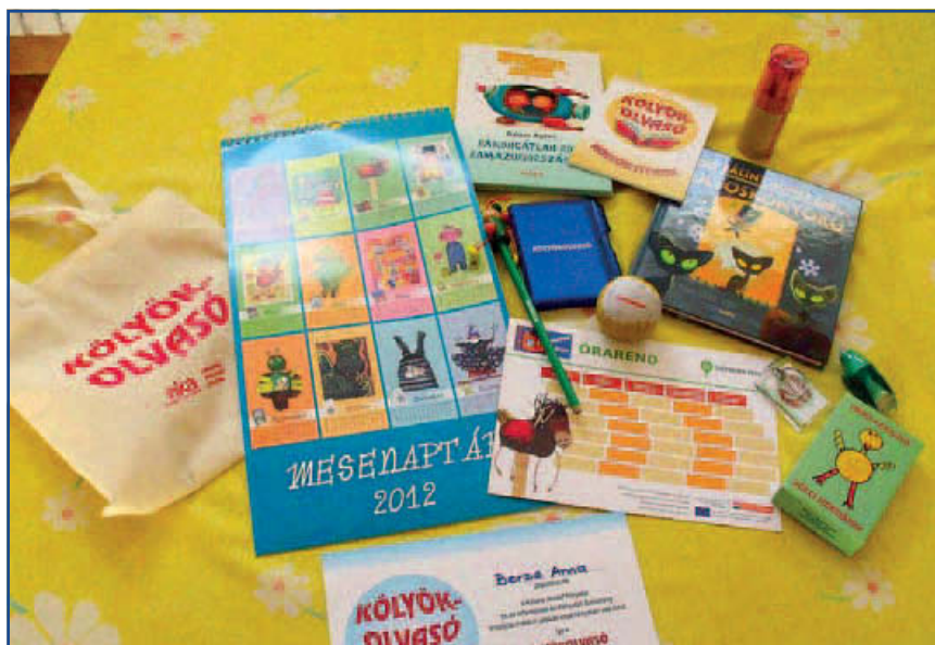
A Kolyökolvasók „jegyei”