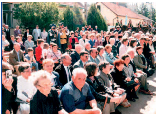
A Tanítók emlékművének avatásán a résztvevők egy csoportja.