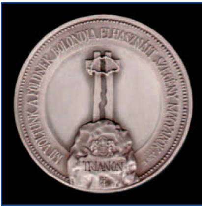
Az érem előlapja (ezüsttel platinázott bronz változat)

Jászfényszaru Város Önkormányzata a június 1-jei Trianoni Emlékmű állítása alkalmából Trianoni Emlékérmeket adott ki.