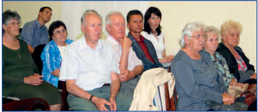
A közgyűlés résztvevőinek egy csoportja