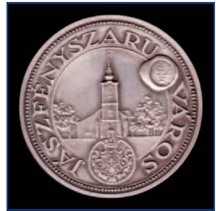
Az érem hátoldala (ezüsttel platinázott bronz változat)