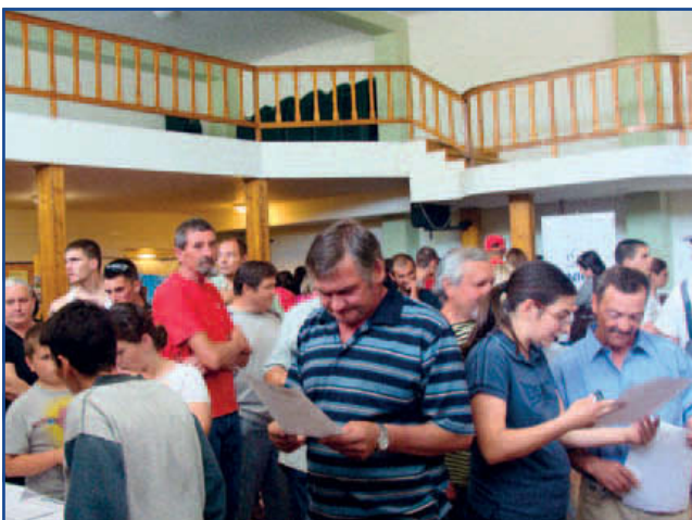
Hogyan is jelentkeztek? Az érdeklődők egy csoportja.

„Nem foglalkoztatják, mert túl öreg, vagy túl fiatal és nincsen tapasztalata, vagy nő és gyermeket nevel, vagy csak egyszerűen nem talál munkát? Jöjjön el, hátha szerencséje lesz!