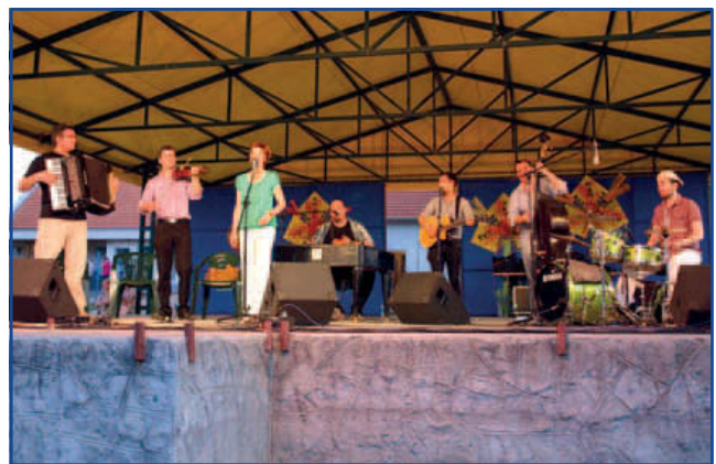
Színpadon a Cimbaliband