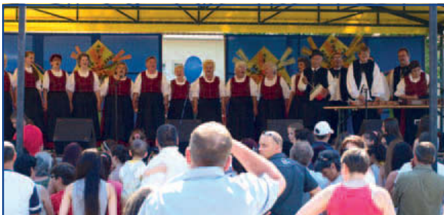
A Pávakör műsora