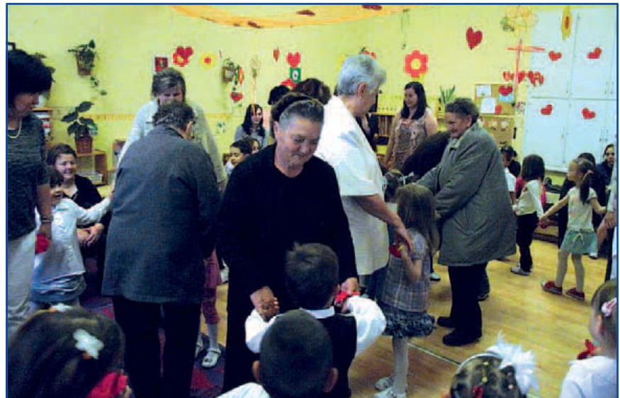
Meghitt pillanat a Napsugár Óvoda Anyák napi ünnepségén