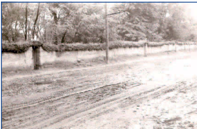
Vertfalú kerítés – Jászfényszaru, 1960.

A jászsági halmaztelepülések a 18. század végén kezdtek kertesedni, amikor a földművelés terjedésével egyre több állatot tartottak otthon. A zsúfolt belső területtől távolabb, külön