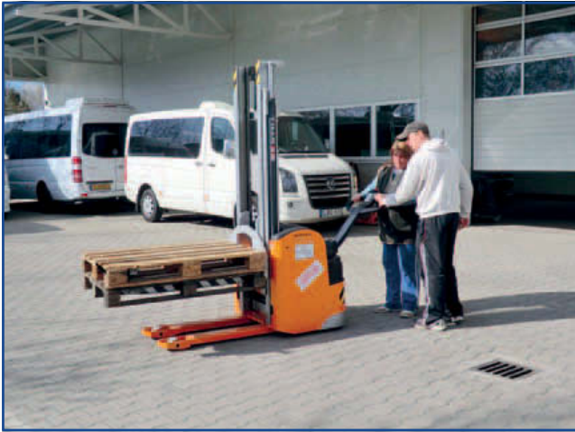
A gépek használata nem is olyan egyszerű!

Több mint tíz hónapos előkészítés és képzés, tanácsadás után, 2012. április 25-én délután került sor az „ Első lépések Jászfényszarun ” című projekt résztvevői részére a targoncavezetői vizsga lebonyolítására az EDU-RÉGIÓ szakképző Központban. A program keretében a felkészítést és a