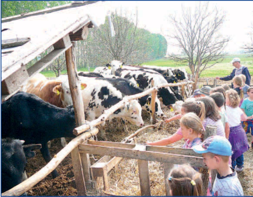
Boci, boci tarka, se füle, se farka?