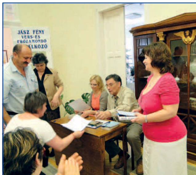
Díjátadás baráti légkörben