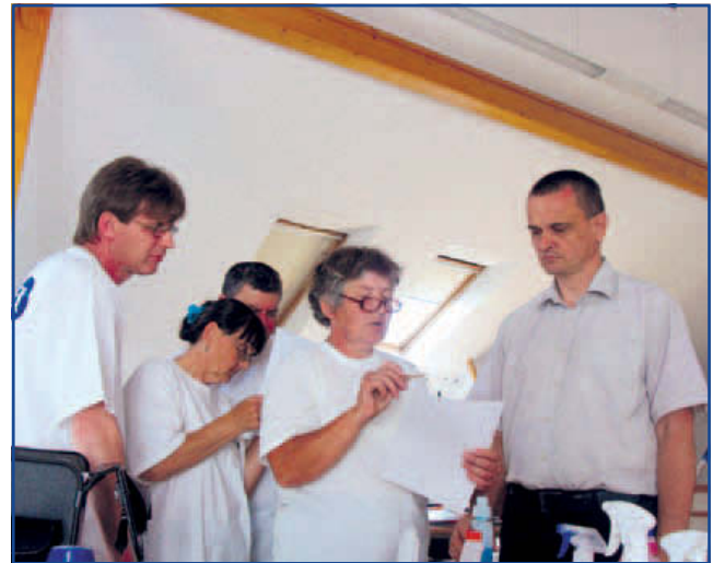
A takarítás nem csak gyakorlatból áll