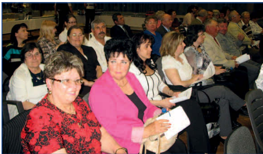
A közgyűlésen a jászfényszarui tagok egy része