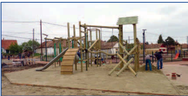
Mászóvár a nagyoknak

Jó ütemben halad az ÉAOP-5.1.1/A-09-1f-2010-0002 jelű, „Szociális városrehabilitáció és lakossági integráció Jászfényszaru fejlődéséért” című pályázat keretében megvalósuló szabadidő park építése az egykori „alvág tó” területén. A kivitelezést a ZÖFE Zöldterület-fejlesztő és Fenntartó Kft. (1119. Budapest, Thán Károly u. 3-5.) végzi, a szerződés szerinti befejezési határidő 2012. június 30.