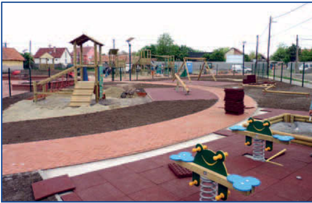
Elkerített játszótér kicsiknek