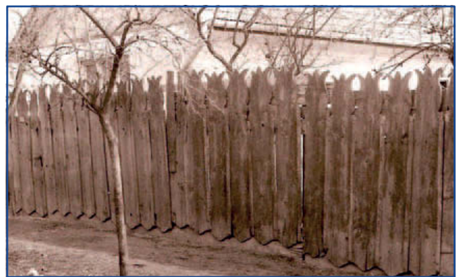
Tulipános kerítés a Malom utcában – Jászfelsőszentgyörgy, 1983.