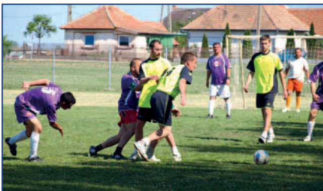
Foci, foci, foci...