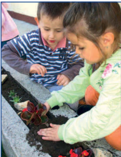
A Szívavány Óvoda Süni csoportja virágültetéssel ünnepelte a Föld napját