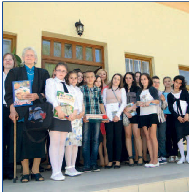
A versmondók népes csapata

Támogatók, rendezőszervek (abc rendben): Általános Iskola, Alapfokú Művészetoktatási Intézmény és Szakképző