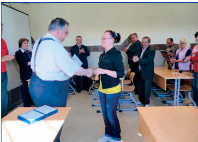
A sikeres targoncavezetői vizsgát követő oklevéltadás

A vizsgára 17 fő jelent meg, ahol az adminisztráció/adat-egyeztetést követően munkavédelmi oktatást és a vizsgáról történő tájékoztatást kaptak a jelenlévők (hiányzás vagy sikertelen vizsga esetén egy másik vizsga lehetőséggel is élhetnek később a résztvevők). Ezen a vizsgán a hallgatók jogosítványt nem kapnak, ehhez majd külön hatósági vizsga szükséges. A Hatósági Jogosítvány géptípusonként szerezhető meg, ami újabb, (csak) gyakorlati vizsgát jelent, egyszerre