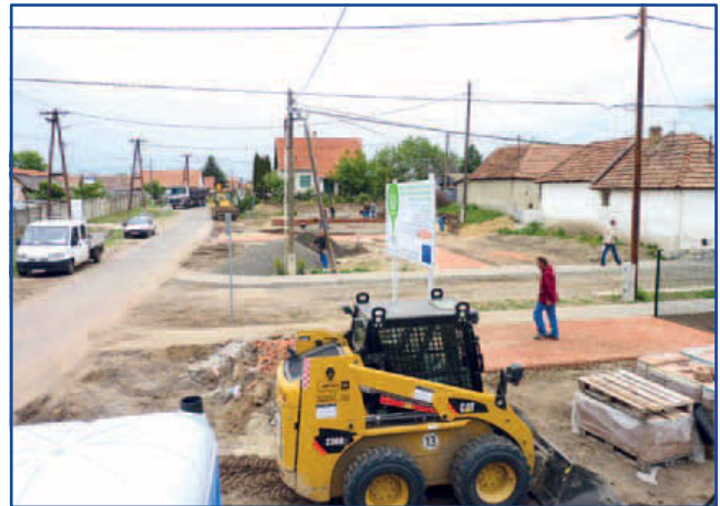
Készül a cigányzenész emlékmű helyszíne