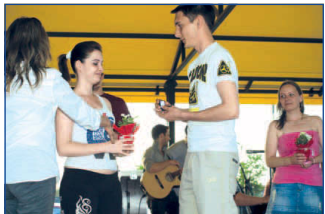
Az aranygyűrű nyertese