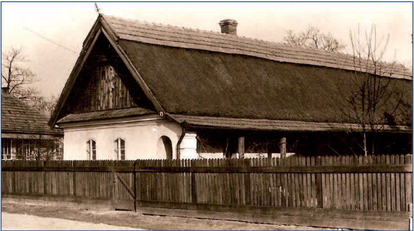
Parasztház léckerítéssel, tornáccal – Jászdózsa, 1982.

A telek teljes körbekerítésére általában nem egyfajta alapanyagot használtak. Általános szokás volt, hogy a komolyabb munkát igénylő, esztétikusabb kerítést az utcai frontra, míg az egyszerűbb anyagból valót a porta hátsó traktusának körbekerítésére használták. Kerítést húztak a lakóház és a gazdasági