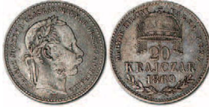
20 Krajczáros pénzérme és 1 forint 1869-ből

„Jászfényszarun és Kenderesen (Hevesmegyében) f. évi mart. 1-jjén postahivatal lép életbe, az utóbbi kisujzállási postahivatallal leendő összeköttetésben.”