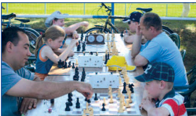
Az elmesport rajongói