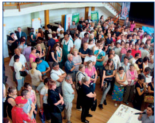
A standok bemutatkoztak

resett foglalkoztatók, széles kínálatot mutattak az érdeklődőknek, hiszen a mai egyre nehezedő gazdasági környezetben minden munkáltató érdeke, hogy képzett, a munkára felkészült munkaerőt tudjon alkalmazni. A munkaadókat, vagy a velük kapcsolatban lévő intézményeket felkértük, hogy vállalkozásukat, cégüket, fejlesztési elképzeléseiket mutassák be ezen az állásbörzén, ahol igény szerint stand felállítására is lehetőséget biztosítottunk. Megszólításra került közel 80 környékbeli és helyi foglalkoztató. Az Állásbörzén – megtöltve a művelődési ház nagytermét – közel 300 fő érdeklődő jelent meg. Tizennégy tájékoztató stand felállítására került sor, ahol 27 fő vállalta a lehetőségek bemutatását, ismertetését. A polgármesteri köszöntőt követően az érdeklődők egy-egy stand köré helyezkedve kaptak közvetlenül is információkat. E közben folyamatosan bemutatkoztak a megjelent intézmények, foglalkoztatók: SAMSUNG Zrt.; Robert Bosch Elektronika Kft; Jász-Nagykun-Szolnok Megyei Kormányhivatal Munkaügyi Központ Jászberényi Kirendeltsége; JNSZM Kereskedelmi Iparkamara; Gondozási Központ; UNIQA Biztosító Zrt.; Éltex Kft.; True Job