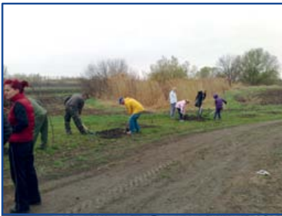
Lehel-tó melletti fáültetés