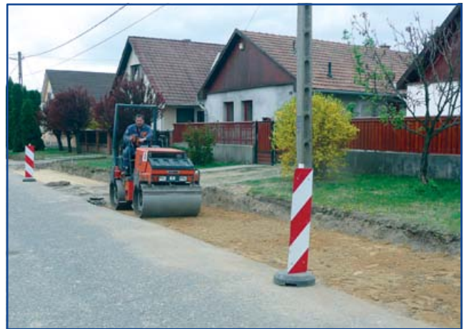
Fürst Sándor utca

A Swietelsky Magyarország Kft. (1117. Budapest, Irinyi János u. 4–20. B ép. V. em.) végzi el a Fürst Sándor út teljes felújítását, hat méterre történő szélesítését, a művelődési ház melletti parkoló kialakítását. Párhuzamos leállású egyoldali parkolók épülnek még a Szabadság úttól a piactérig. Ehhez a beruházáshoz tartozik még a Szabadság úttól a Dobó Katalin utcáig húzódó 20 kV-os légvezeték földkábelbe történő helyezése, díszkandeláber kiépítése. Ezen a szakaszon az út mindkét oldalán zárt csapadékvíz elvezetés