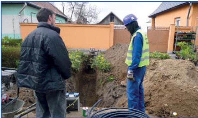
József Attila utca