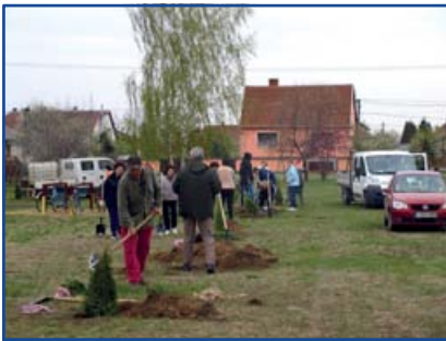
Deák téren a játszótér mellett fa és tuja ültetése