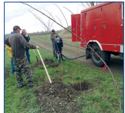
Tűzoltók locsolják a frissen ültetett fákat

Az ültetéshez szükséges szerszámokat a GAMESZ biztosította a résztvevők számára, mely eszközöket kisteherautóval a helyszínre is szállított. Közvetlenül az ültetés után a fák megöntözése is megtörtént: a tűzoltók a tűzoltókocsiból, a GAMESZ pedig viztartályból locsolta a fákat.