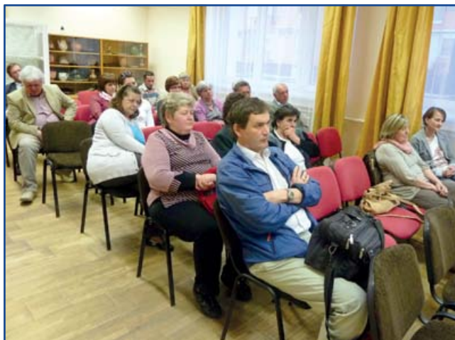
A találkozó közönsége