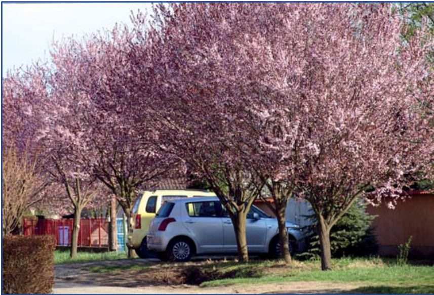
Legszebb fasor – Pipacs utca

sokat. A JKHK Egyesületéhez a LEADER 2. körben 84 darab pályázat érkezett be, ezek alapjogosultsági vizsgálatának lezárását követően postáztuk a hiánypótló végzéseket, amelyek feldolgozása február végéig megtörtént. Az alapjogosultsági és az adminisztratív ellenőrzést követően összesen 14 kérelem került elutasításra.