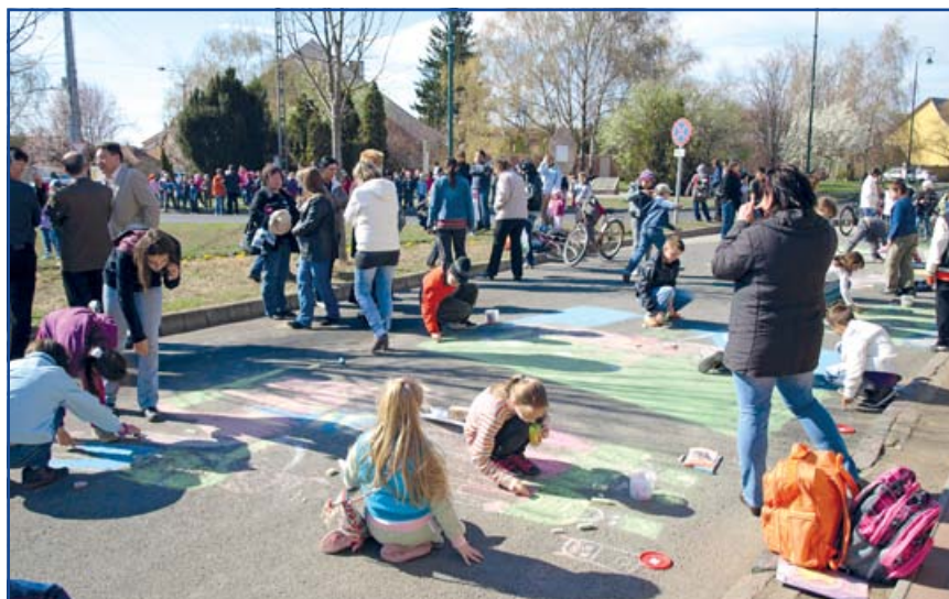
Születésnapi aszfaltrajz-verseny Jászfényszaru főterén.