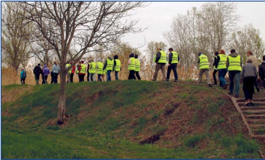
Séta a Madárles melletti tanösvényen