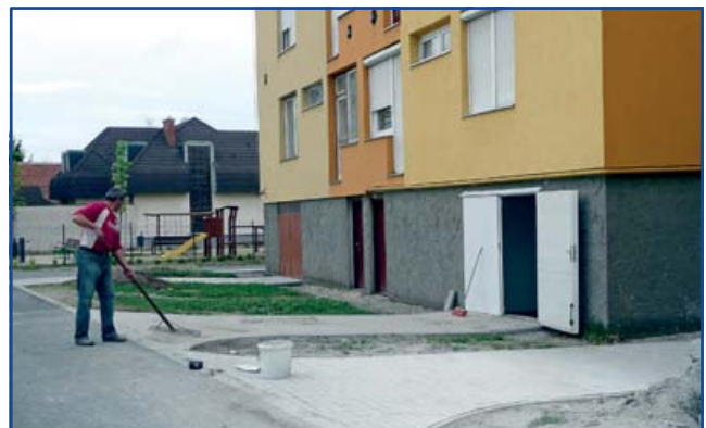
Vasvári utca. További képek: 11. oldal