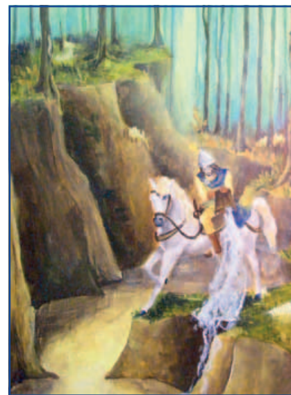
A mondabeli Csörsz vezér (Sára Cintia Erika festménye, 2010.)

A kiállításon többek között megismerkedhetünk a Csörsz-árok történelmével,