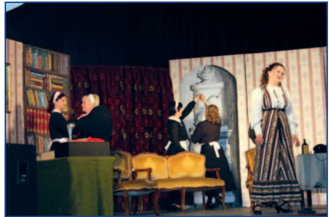
Fent: képek Eliza Doolittle életéből. Lent: Sokan tekintették meg a My Fair Lady című előadást.