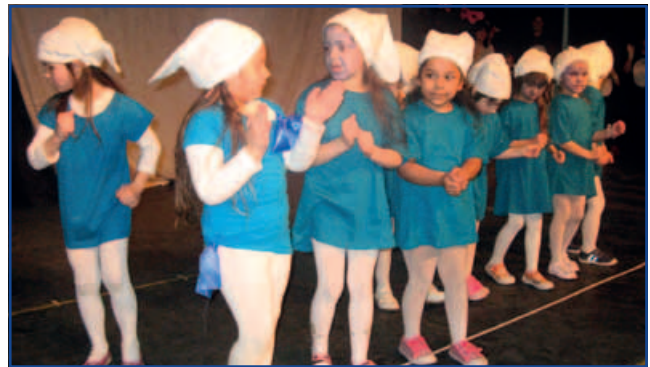
...és Hupikék Törpikék

„Elmúlt farsang el, el, el. Kinek használt, kinek nem. Nekem használt, neked nem. Én táncoltam, te meg nem”