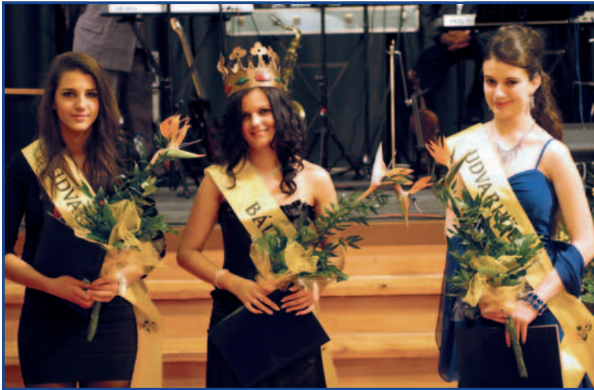
A Fébe-bál szépei

báli műsorában most debütált, bízunk abban, hogy máskor is hallhatjuk majd. Négy számot, három különböző stílusút énekelt, különös élményt jelentett a Csík zenekar Most múlik pontosan című száma. A zenei kíséretet a mezőtúri Berczeli Endre zongoraművész biztosította.