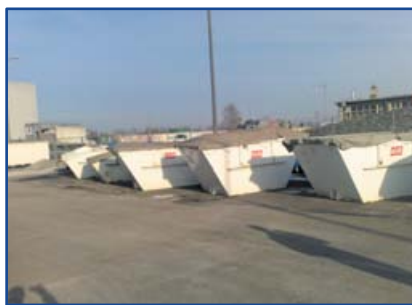
Ugyanitt sitt gyűjtésére szolgáló konténer:

A megépített hulladékudvarok közül egy Miskolcon (az AVE által létesített hulladékudvar képe), ezek a konténer a kisebb méretű hulladékok szelektív gyűjtésére és ideiglenes tárolására szolgálnak.