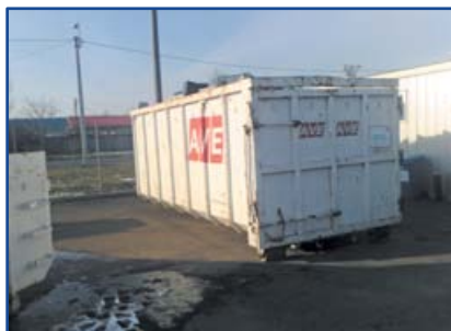
Említett hulladékudvarban nagyméretű lom gyűjtésére konténer (bútorok):