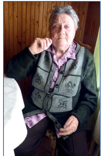
Október hónapban az önkormányzat 90. születésnapja alkalmából