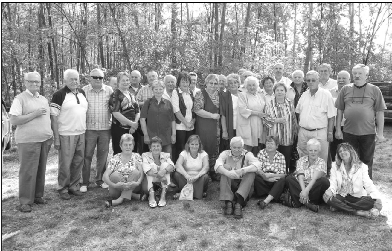
A kalapgyári dolgozók első találkozásának résztvevői 2011. szeptember 30-án a Vadászháznál.