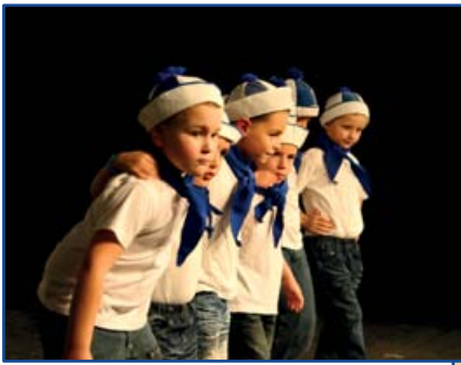
OVIBULI 2011 NOVEMBER 19. PETŐFI MŰVELŐDÉSI HÁZ