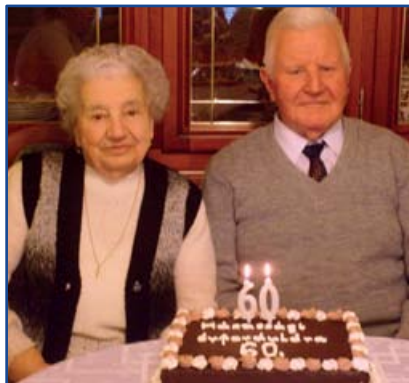
60. házassági évfordulójukat ünnepelték november 11-én