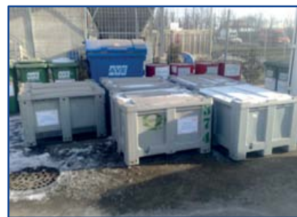
Pécson a hulladékudvar tervezésének fázisában látványterv a hulladékudvarról:

vörösréz, növényvédő szerrel szennyezett anyagok, motor-hajtómű- és kenőolaj hulladékok):