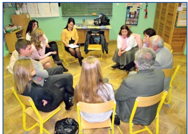
Vérbeli kiscsoportos megbeszélés

kal. Beülős helyre lenne szükség, ahol spontán társasági élet alakulna ki, egy bejárattal, ahol el lehet járni bármikor, külön szervezés nélkül.