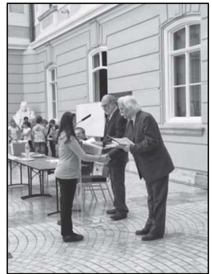
A 2011 évi pályázati eredményhirdetés a Budapesti Történeti Múzeum Barokk csarnokában, a díjakat átadja Ráday Imre a szövetség elnöke és dr. Katona Tamás történész.

A pályázatokat 2012. január 31-ig a Város- és Faluvédők Szövetsége (Hungaria Nostra) 1126 Budapest, Szoboszlai u. 2-4. címre kell elküldeni. A díjazottak között sok értékes könyv és játék kerül szétosztásra.