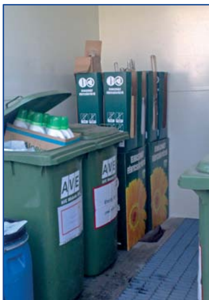
Kiseb hulladékok szelektíven gyűjtve és ideiglenesen tárolva (akkumulátorok, olajjal szennyezett anyagok, réz, alumínium,

vörösréz, növényvédő szerrel szennyezett anyagok, motor-hajtómű- és kenőolaj hulladékok):