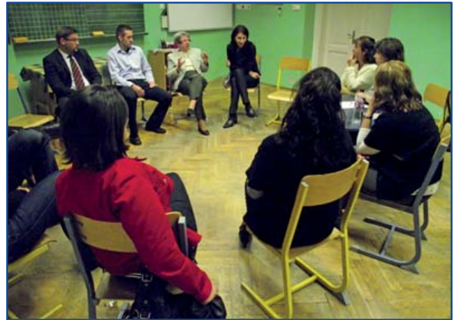
Beszélgetés a családalapításról

Az eddigi lehetőségek sajnos különböző okok miatt megszűntek. Olyan ötlet kellene, amely megvalósítható és egyezik az elvárások-