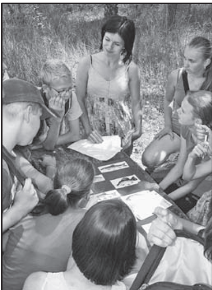
Tőparton stilszerű feladat – halfelismerés

Kedden a Kalapgyári-tavakhoz kerékpároztak ki évfolyamonként a gyerekek, hogy egy kellemes délelőtt keretében zárjuk le a Heuréka! vetélkedősorozatot. A festőien gyönyörű környezetben, a tó körül különböző kihívásokkal találták szemben magukat az osztályok.