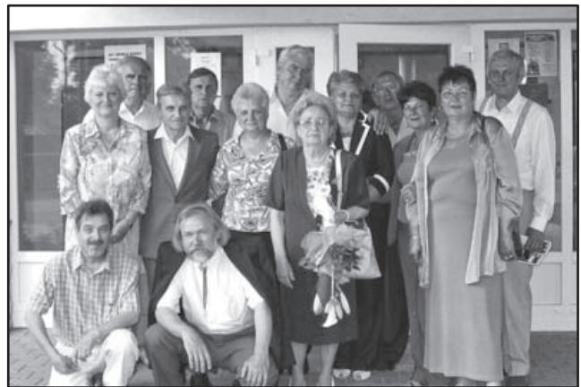
A VIII. C az újjiskola előtt