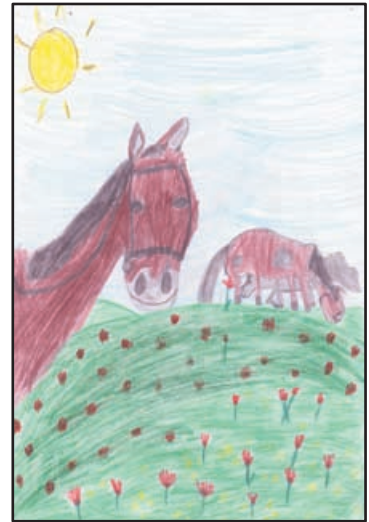
Tóth Bibiána rajza