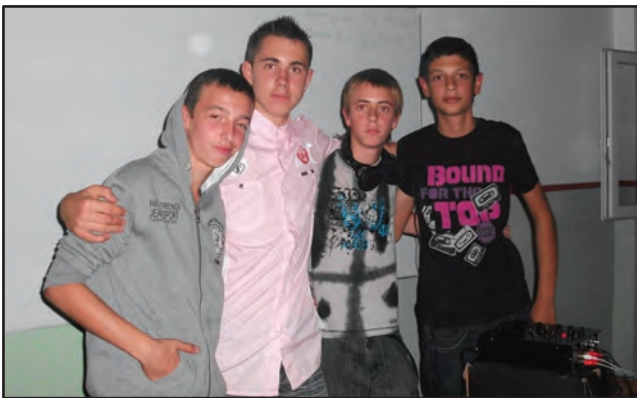
Lemezlovások a DÖK-klubban