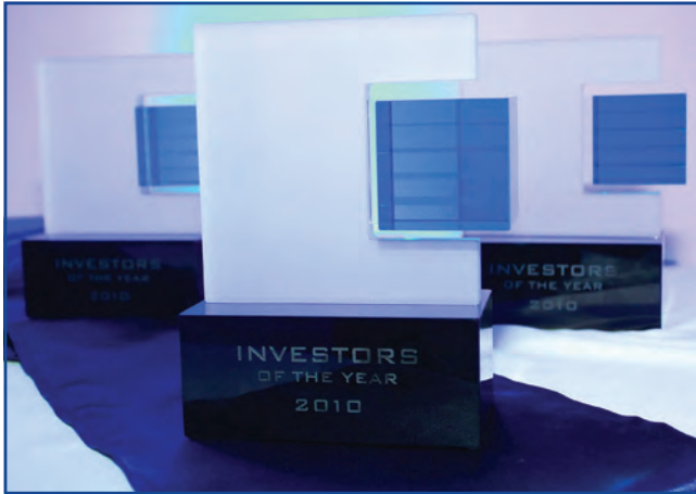
„Az Év Befektetője” díj

Az ITD Hungary Magyar Befektetési és Kereskedelemfejlesztési Ügynökség 2004-ben alapította meg „Az Év Befektetője” címet, elismerve azon befektetők tevékenységét, akik az adott évben a legnagyobb mértékben járultak hozzá a magyar gazdaság fejlődéséhez, a foglalkoztatottság növeléséhez.