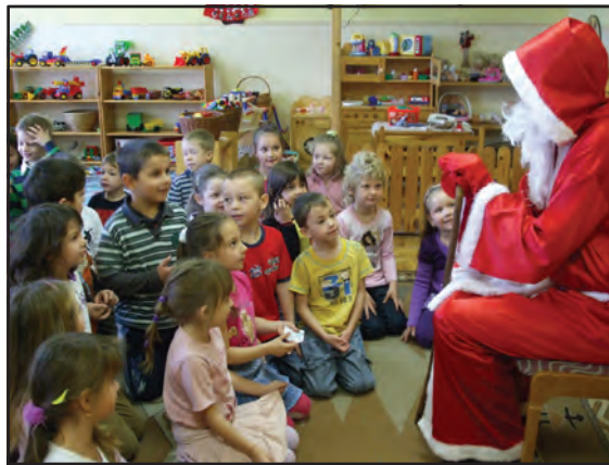
Mikulás a Szivárvány Óvoda Katica csoportjában.