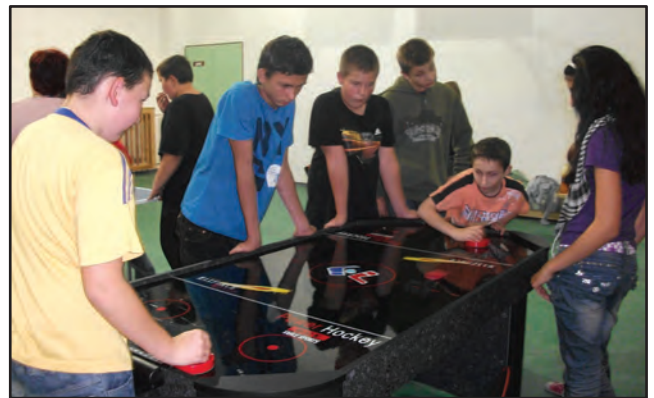
Léghoki a DÖK-klubban