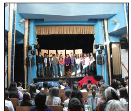
Dalverseny: 8. b