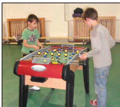
Csocsó a DÖK-klubban