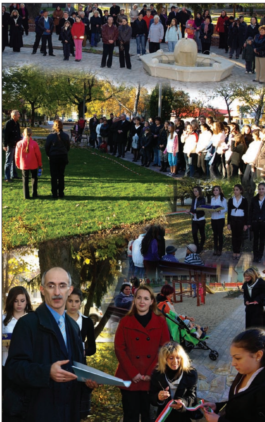
Október 22-én ünnepélyes keretek között vette birtokba a lakosság a művelődési ház előtti parkot. A montázs Tóth Péter és Zsámboki Richárd képeiből készült.