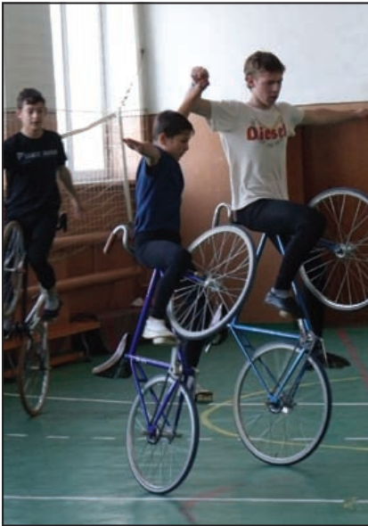
Rögtönzött kerékpáros-akrobata bemutató