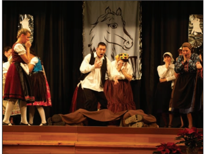
A Tóalmási Titánok „Narancs” című műsora a II. Fogathajtó bálon