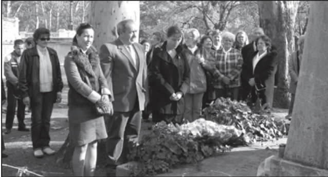
Koszorúzás Erkel Ferenc sírjánál

A Fényszaruai Baráti Egyesülete és a Városi Könyvtár által meghirdetett önköltséges budapesti „Erkel” kirándulásra 38 fő jelentkezett. Az időpont választásánál az Erkel születésnapját megelőző napot, november 6-át választottuk.