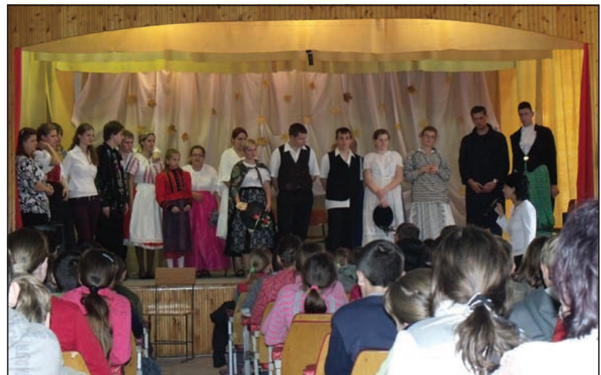
A nagyberegi fellépő csapat

A gáti vendéglátó családnak elfogyasztott finom ebéd és röpké pihenő után beindult az „Énekesmadár” gépezete. A helyi iskola kis színpadán megannyi szorgos kéz