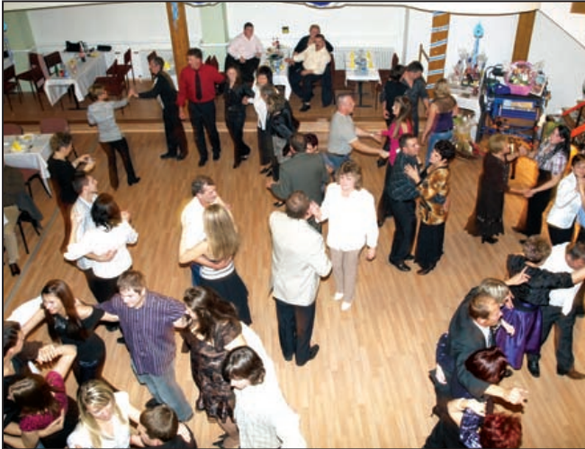
A báli közönség a II. Fogathajtó bálon