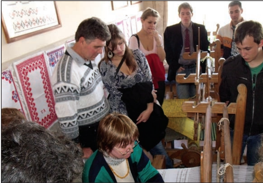
A szövést nehéz mesterséget figyeljük