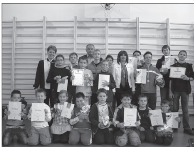
A sakkverseny résztvevői