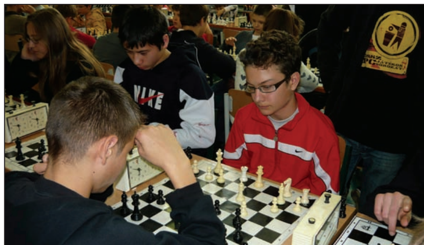
Sakkverseny iskolánkban: versenyzés közben