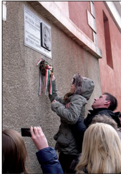
Bethlen Gábor emléktáblájának megkoszorúzása

Vasárnap a délelőtti szintén a magyar vonatkozású történelmi helyszínek megismerésével töltöttük, Munkácson felsétáltunk a szépen helyreállított várba. Sajnos csak két óra állt rendelkezésünkre, hisz már