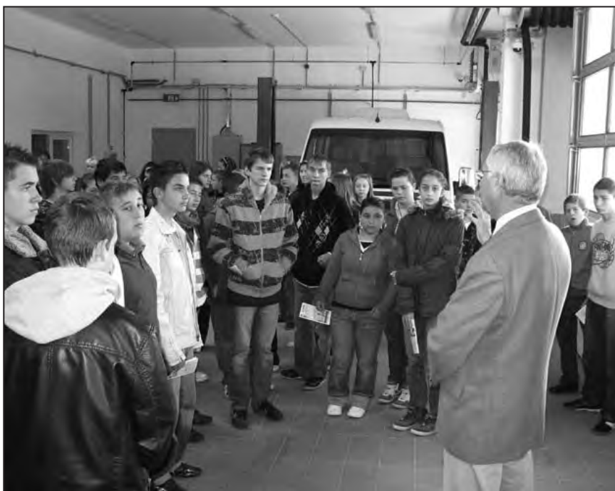
Pályaválasztási tanácsadáson, Jászberényben

Kedves Pályaválasztók! Várunk az iskolánkba – fontos számunkra, hogy biztonságban, jó körülmények között tanulhass és a szakmai tudásod a lehető legjobb legyen!