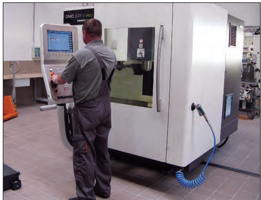
CNC forgácsoló az új szakképző központban, Jászberényben

giellátásra, napelemek (28 db) és napkollektorok (12 db) beépítésére, működtetésére került sor. További terv az alternatívák bővítése – egy szélenergiás építésként is. Cél a szakképzés elaprózottságának csökkentése, együttműködés a szakképzés további szereplőivel. A tanműhely csarnok mellett tan-