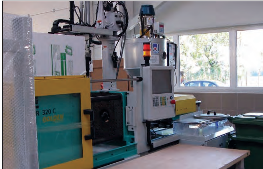
Műanyagfeldolgozó gép az új szakképző központban, Jászberényben