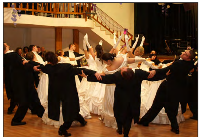
A nyitótánc.