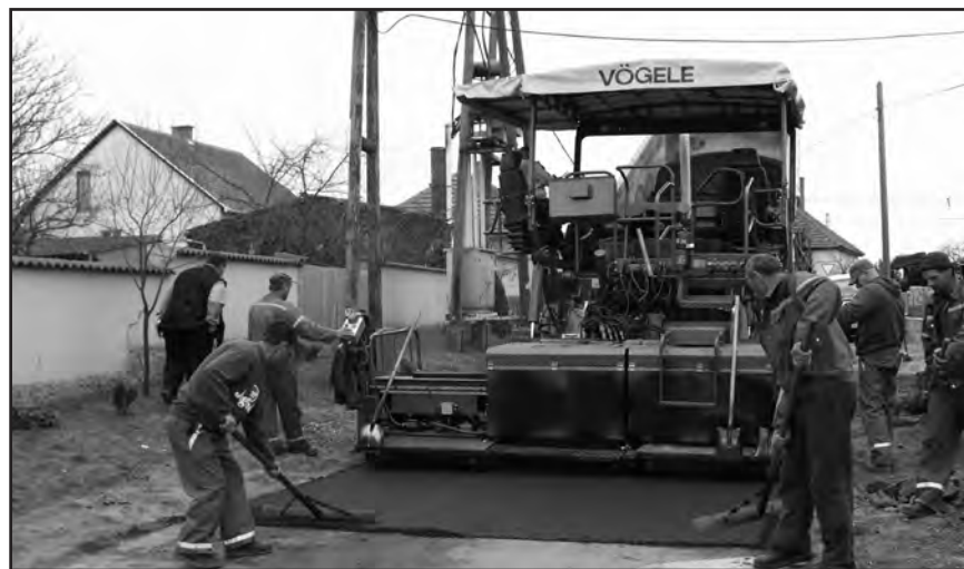
Aszfaltozás a Bethlen Gábor utcában.

Vigné Zsámboki Ildikó szociális ügyintéző