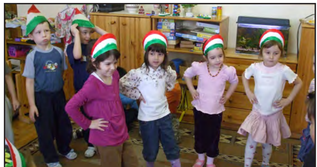
A Katica csoportosok a maguk készíttette csákóiban és pártában.