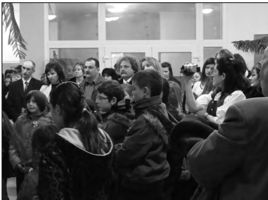
A megnyitó résztvevőinek egy csoportja