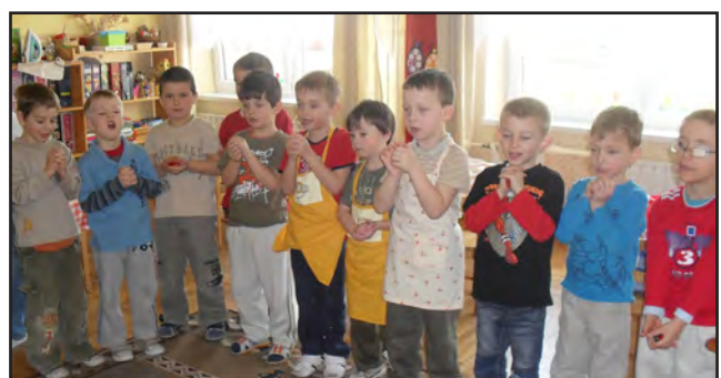
A nőnapra meglepetés készítői.