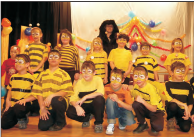
Méhecskék (2. c osztály)

„...de mi azt nem bánjuk...” – hangzik az egyik ide vonatkozó népdalban, s mi sem bánjuk különösebben, mert nagyot mulattunk a gyerekek által várva-várt napon, február 13-án, amikor az alsó tagozat 2010-es farsangi báljára sort kerítettünk.