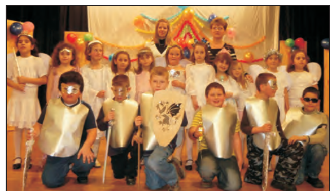
Angyalok és lovagok