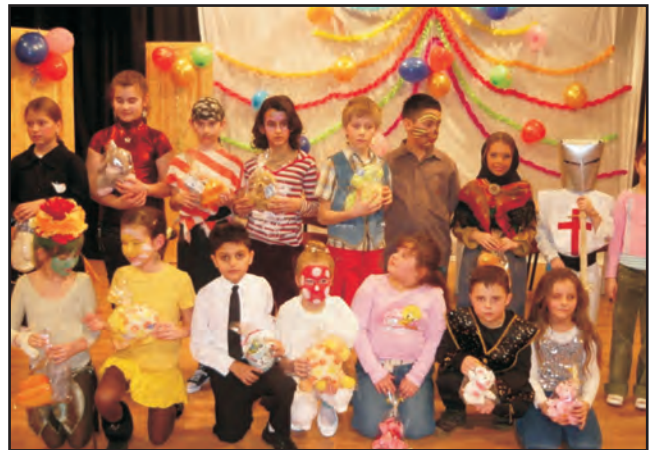
Egyéni jelmezek nyertesei

Iskolánk pedagógusai is több ilyen továbbképzésen vettek már részt a tanév során: