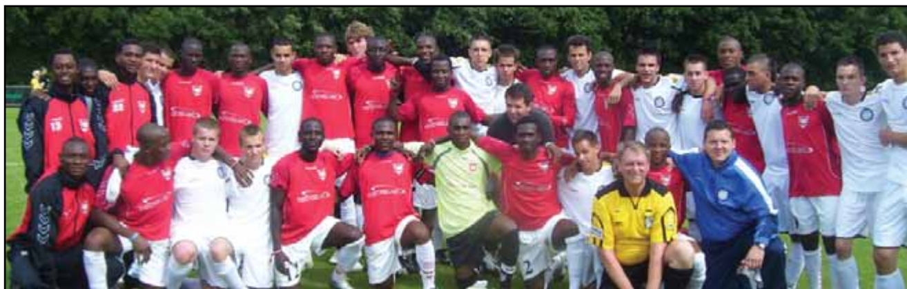
„...rangos csapatok ellen játszhattunk, csodálatos tájakon jártunk, új barátokat szereztünk.” – DANA CUP 2009, beszámoló a 14. oldalon