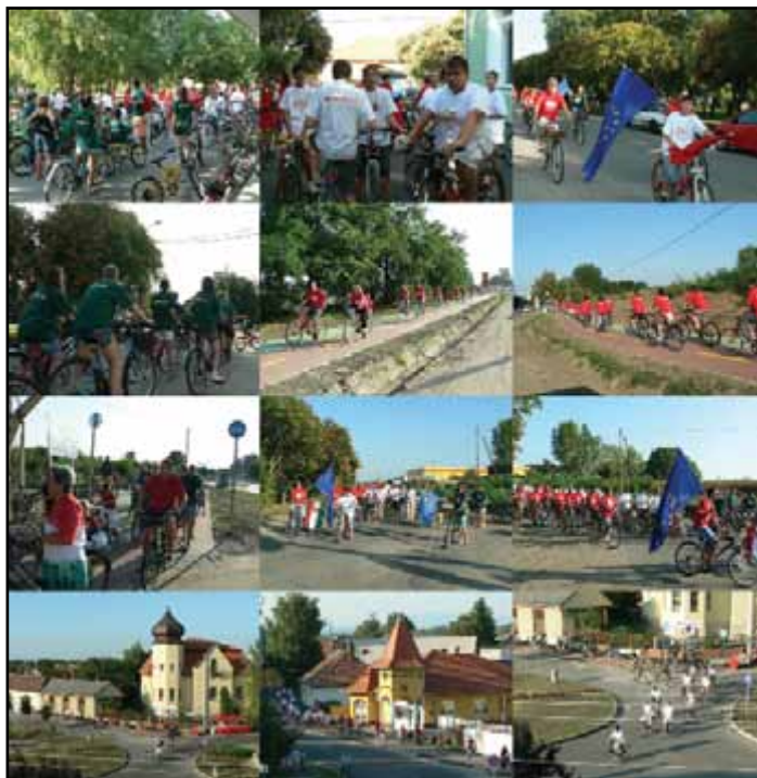
Augusztus 19-én több mint 300 biciklis avatta fel a kerékpárutat