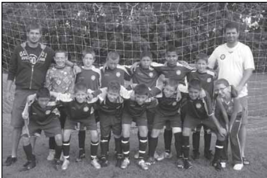
Az U-13 csapat tagjai finn ellenfeikkel barátkoznak