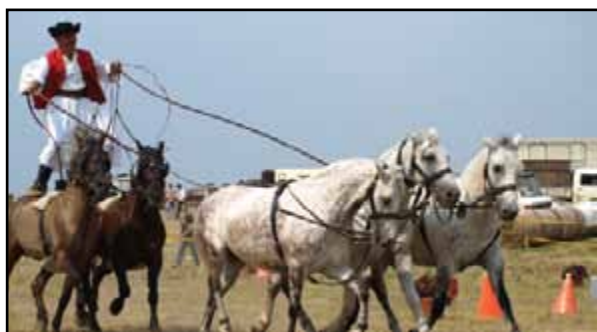
A fogathajtó verseny egy látványos produkciója