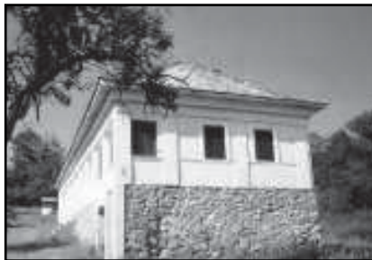
A szuhafői paplak

szabadtéri színpadon változatos kulturális programoknak tapsolhatott a majd 200 lelkes település apraja-nagyja. Mint mindig, most is nagy szeretettel fogadtak bennünket. A főzőverseny zsűrijébe is felkérték minket.