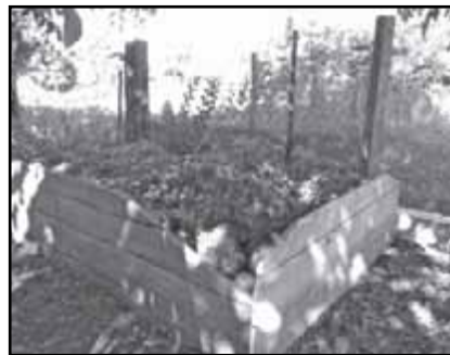
Egyszerű, házi komposztáló

A kukába kerülő háztartási hulladéknak az egyharmada olyan alapanyag, amelyből minden különösebb fáradság nélkül komposzt készíthető (a konyhából kikerülő zöldség, gyümölcs maradványokból, falevelekből, levágott fűből, elszáradt virág-ból) és komposztálás után a kertben újra felhasználható.