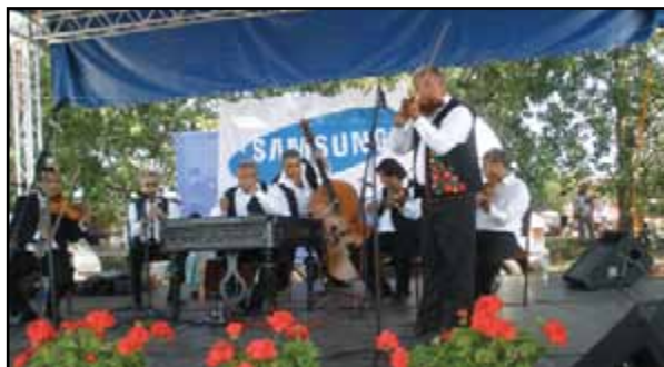
A Jászfényszarui cigányzenekar a II. Tarlófesztiválon