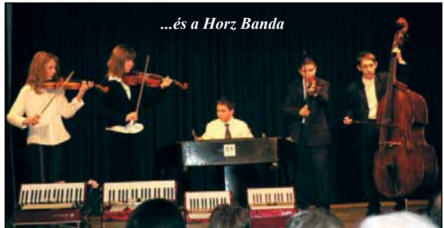
...és a Horz Banda