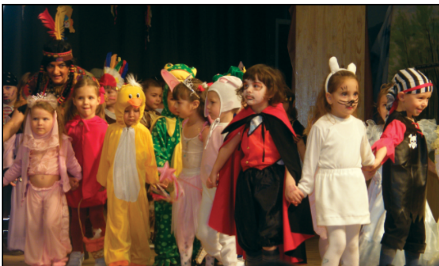
A Szivárvány óvoda farsangi bálja február 7-én, a művelődési házban.