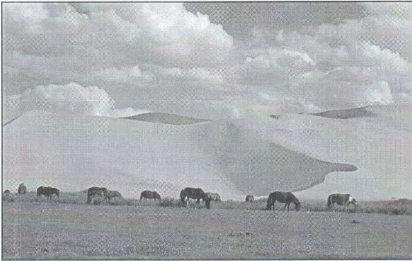
Az éneklő homokdűnéknél

Túránk legdélebbi pontján a híres Yolin Am-ot (Keselyű-szurdok) tekintettük meg, hol még a júliusi hőség ellenére is megcsodálhattunk a szurdok mélyén csörgedező kis patakot, mely egy idő után a sajátos mikroklíma miatt megfagyott és hatalmas jégfalat képezett. Tovább utazva jártunk a sivatag híres „Éneklő homok-dűnéinél” hol csak nagyon nehezen tudtuk megmászni az egyik meredek dűnét. A vendéglátó család kétpúpú tevéin tevelgettünk is a szálláshoz közeli forráshoz. Tovább utazva eljuttunk egy dinoszaurusz lelőhelyre. Itt megtekintettük a jurtában berendezett múzeumot, melyben ismét láthattunk dinoszaurusz tojásokat, csontokat, sőt teljes csontvázat is.