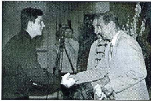
A felvétel a diplomaosztó ünnepségen készült.

A három év elméleti képzés után egy évet gyakornokként egy termelőüzemben lehetett eltölteni. A diplomamunka gyakorlati része az itt szerzett tapasztalatok felhasználásával áll össze. Összegezve az elméleti tudás mellé gyakorlati ismereteket is szereztünk, ami a munkába állást segíti. Az iskola-padból nem közvetlenül kerülünk a nagy-