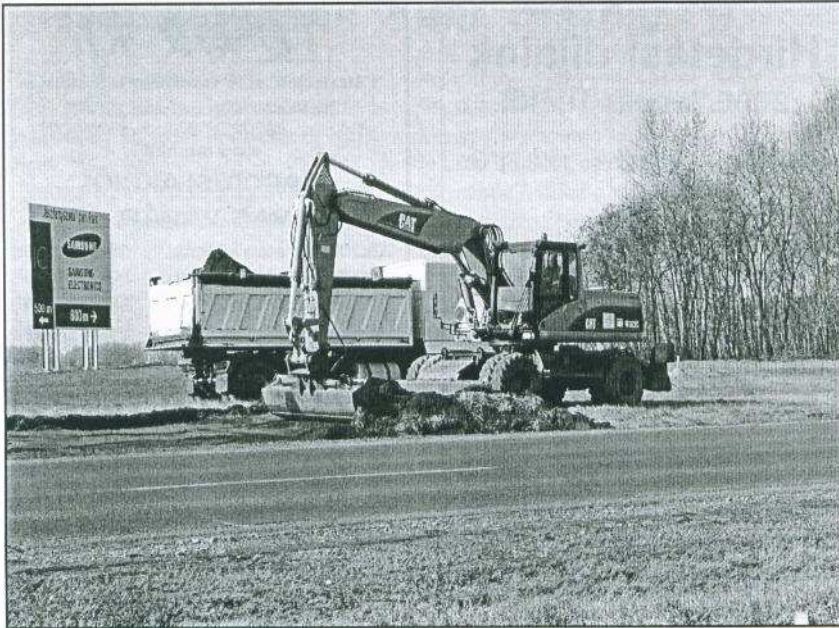
Épül a körforgalom a 32-es főút jászfényszarui leágazásánál. A munkálatok befejezése nyár közepére várható.