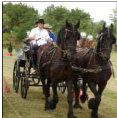
A fotókat Pető István készítette a július 7-én, Jászágon megtartott amatőr fogathajtó versenyen.

nikációs tevékenységgel mintegy 180 érdeklődővel és 110 fő bevonásával – részletesebben: