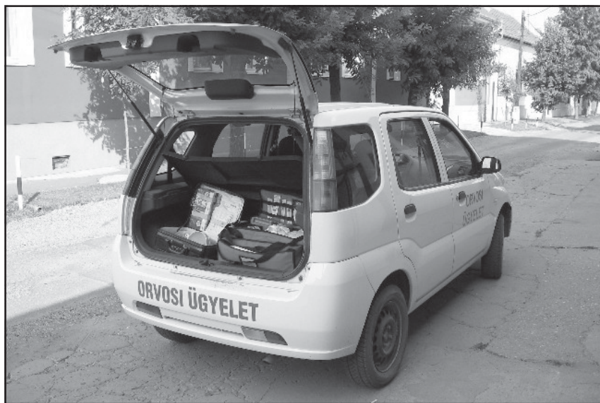
Kép és szöveg: Ügyelet 60 Kft.

A háziorvosi ügyeleti szolgálat sürgősségi ellátás, melyet kérjük, hogy csak valóban sürgős szükség esetén vegyenek igénybe. Amennyiben ezt, mint kényelmi szolgáltatást kívánják igénybe venni, veszélyeztetik a valóban rászorulókat ellátását.