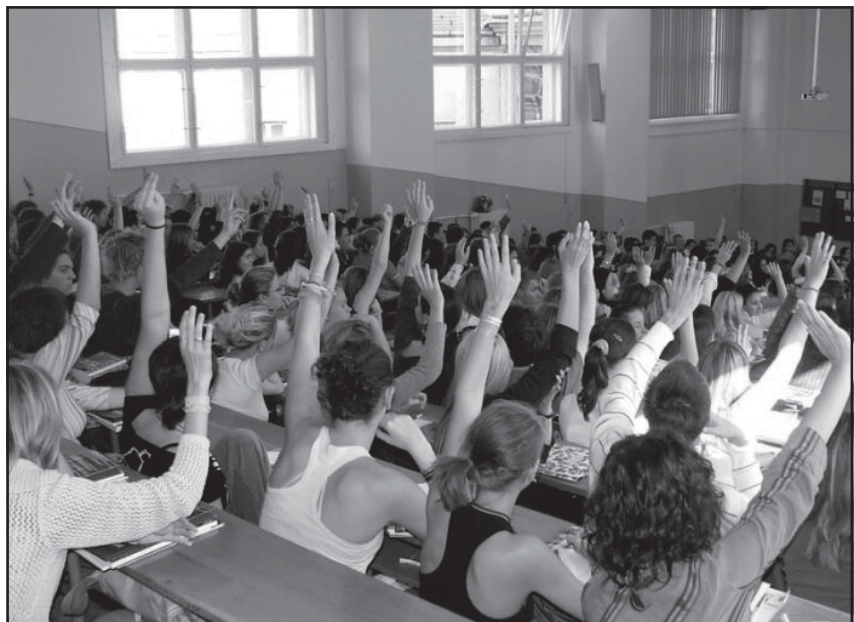
Ki készül emelt szintre?

Több mint ezer továbbtanulásra készülő diák látogatott el a Felvételi Információs Szolgálat Központi Érettségi Nyílt Napjára, ahol a 2006-os felvételi stratégiákkal kapcsolatban kaphattak útmutatást az érdeklődők.