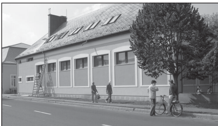
Fent: Még egy kis igazítás.