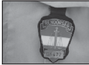
A szabályos egyenruhán, jobb oldalon található a névtáblát, míg bal oldalon az öt számjegyet tartalmazó jelvényt.