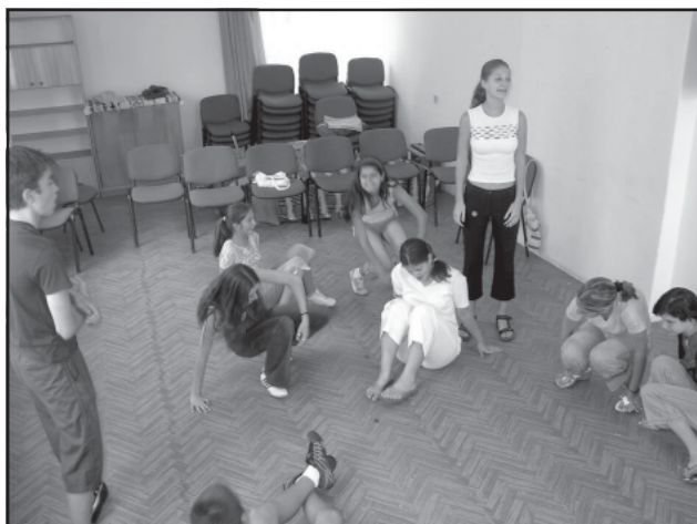
Fent a Napsugár, lent a Fortuna próbál.