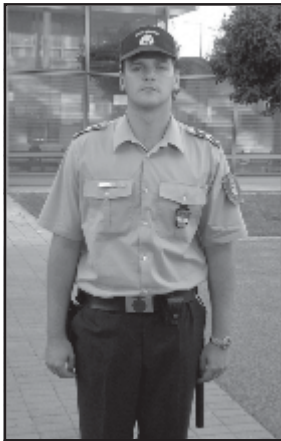
Az egyenruhás rendőr szabályos, nyári viselete.

Ezüst váll-laphoz csak ezüst jelzésű sapka tartozhat.