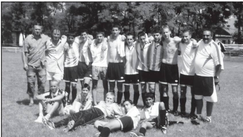
Az aranyérmes serdülő csapatunk, akik a Jászfényszaru Csoportban megnyerték a 2004/2005. évi labdarúgó bajnokságot.