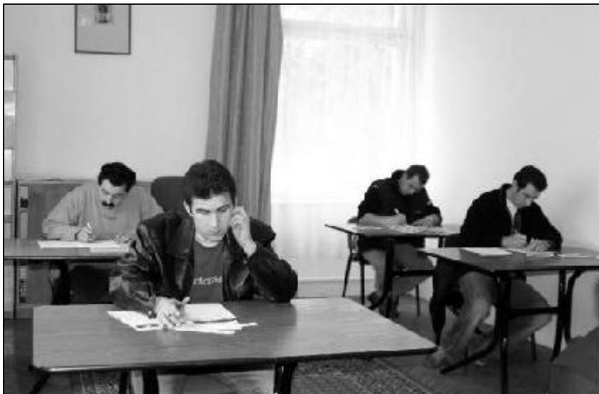
Vizsgáznak a gazdatanfolyam résztvevői.

A fent említett programjainkra igen nagyszámú volt a térségi érdeklődés, ezért folytatjuk e partnerségi együttműködések, még május-júniusban. Így sor kerül – NCA támogatással – egy Civil Fórumra és egy civil képzésre. Ezen felül a Grafológiai Barátok Országos Egyesületével közösen grafológiai szabadegyetemet indítunk.