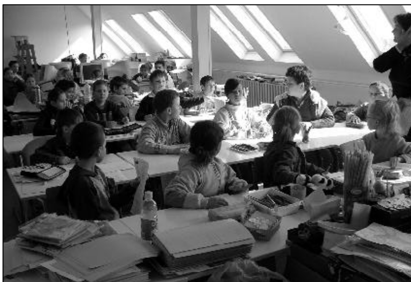
Környezetvédelmi óra az általános iskolában. Az április 9-i városi környezetvédelmi napról képes riport a 3. oldalon.