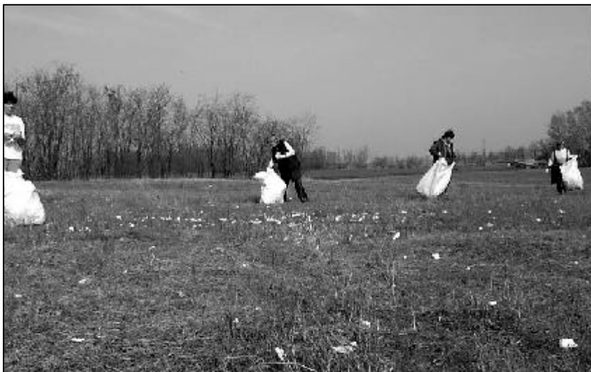
A felvételek az április 9-i környezetvédelmi napon készültek.