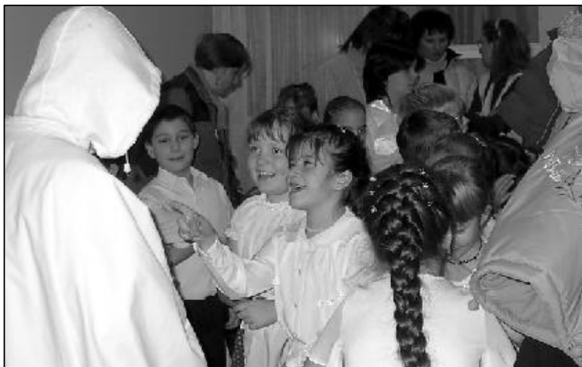
Luca-napi kavalkád. További képek és olvasnivaló a 4. oldalon.