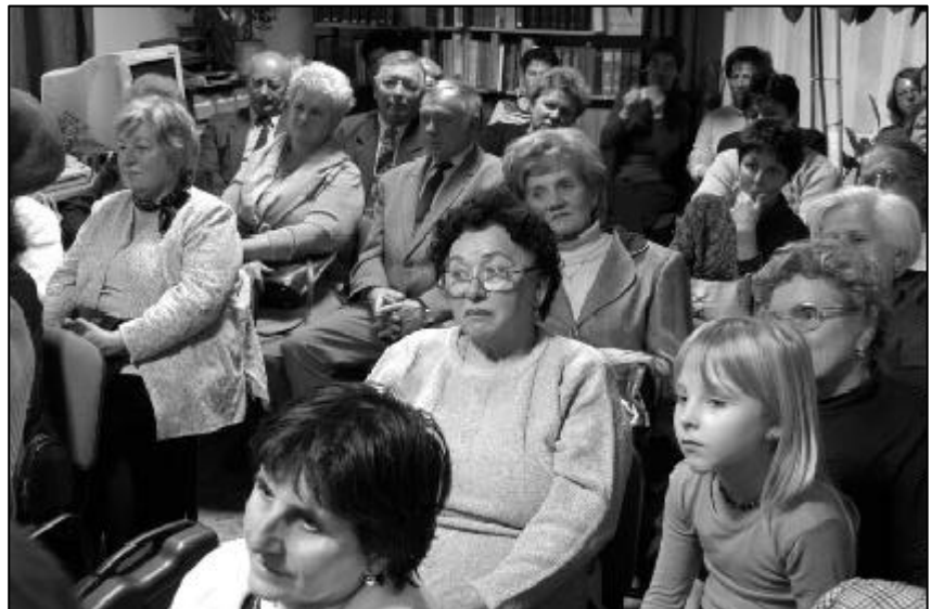
A fotókiállítás és könyvbemutató megnyitóján.