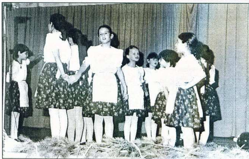
Az első „fecskek”.