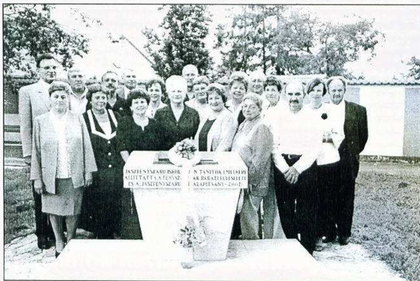
2004. szeptember 4-én 40 éves osztálytalálkozót tartottak az 1964-ben végzett VIII. B és VIII. C osztály tanulói.