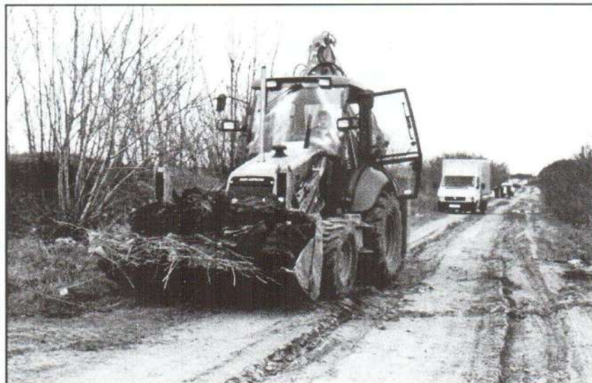
Nemcsak a fantáziánkat, de erőnket is meghaladja már: mi-mindent tudnak elrejteni valakik. De kik?