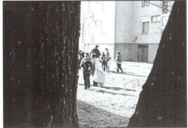
Az Általános Iskola, Kooperatív Művészeti Alapiskola és Szakiskola tanulói, tanárai is részt vettek a takarítási akcióban.