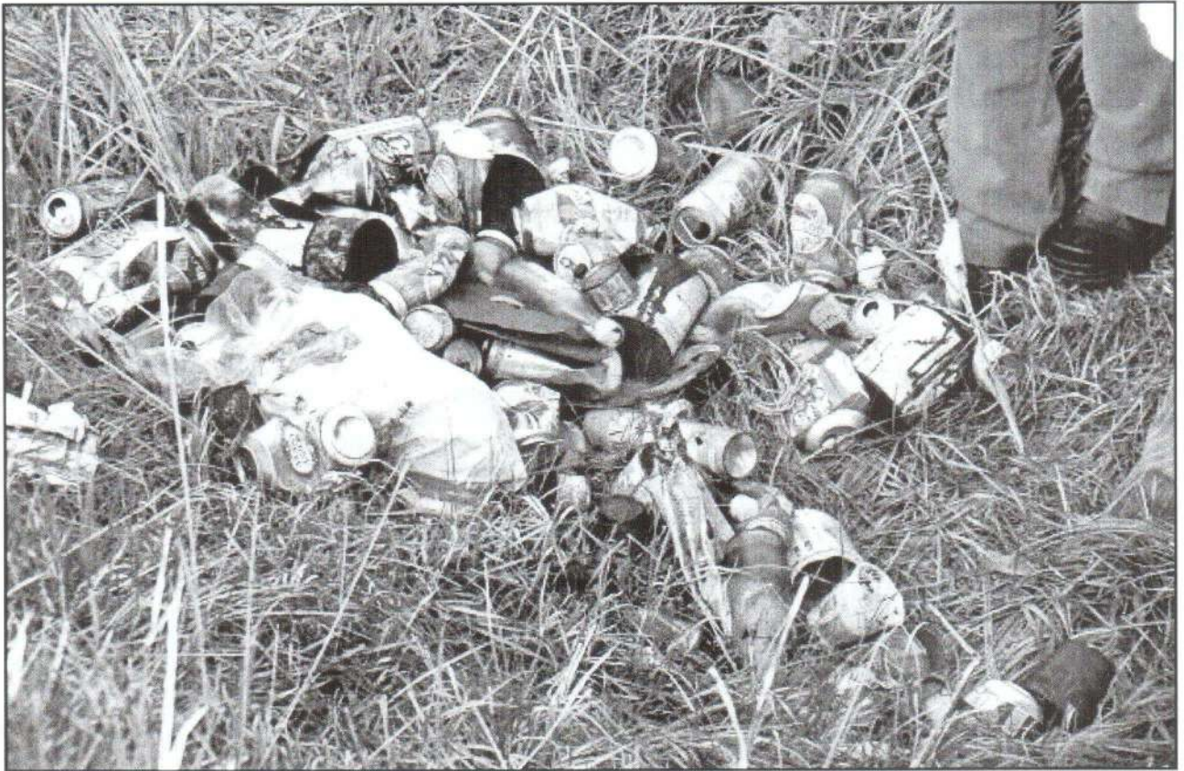
Ezt sem a nyuszi hozta!