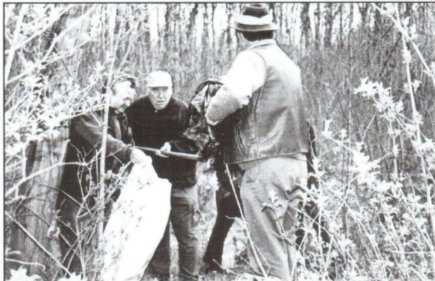
„Erdő mellett nem jó lakni” – de nem azért, amiért a dal szerint...

A kijelölt hulladéklerakóba veszélyes hulladék nem helyezhető el.