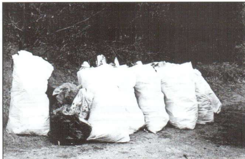
A zsákok tartalmát nem akarjuk viszontlátni!