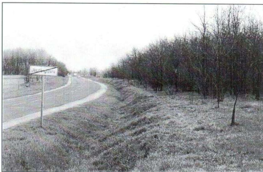
Takarítás után. Előtte és közben: beszámoló a 4-5. oldalon.