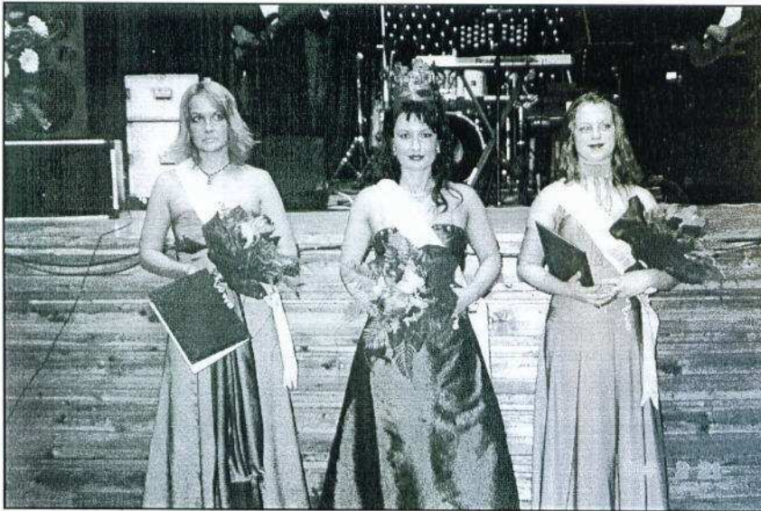
A bál legszebbjei.

Az idén február 21-én szombaton rendezte meg a FÉBE a jótékonyági műsoros estét és bálját. A rendezvény fővédnöke ezúttal a helyi születésű Tóth Gábor ügyvezető, országgyűlési képviselő, a környezetvédelmi bizottság tagja volt. Megnyitó beszédében kiemelte a rendezvény jelentőségét, hogy „...lehetőséget teremt arra nekünk, hogy akik gyökereiket tekintve fényszaruinak vallják magukat, azok legalább évente egyszer egyszer tudjuk egymást látni.” Beszédét a következő szavakkal zárta: „Kívánom nektek, hogy legyetek nagyon sikeres európai polgárok, jó magyarok, és legfőképpen szülőföldjükhöz hű jászok.”