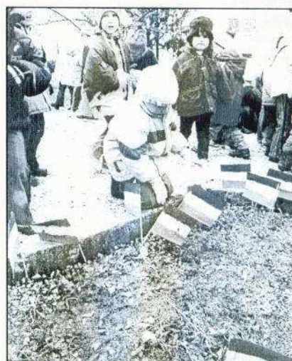
Március 13-án óvodások jártak az ünnepség helyszínén.