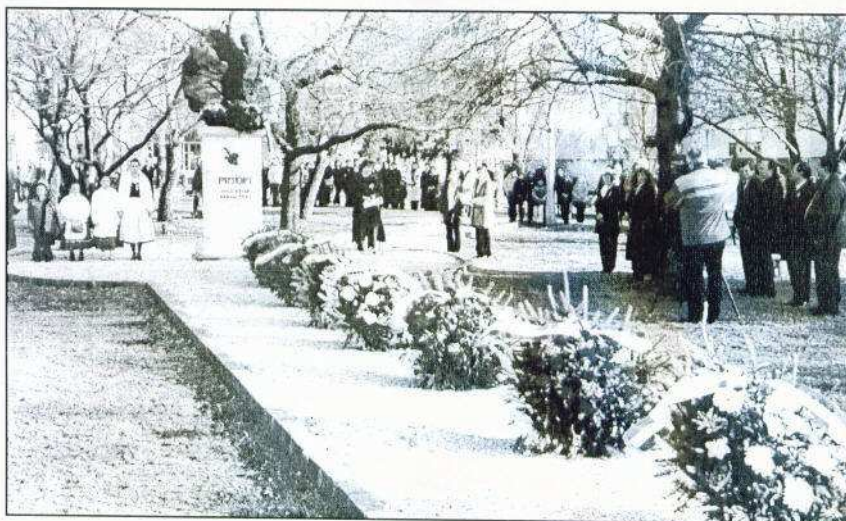
Az emlékezés koszorúit a város társadalmi és civil szervezeteitől.

Nemzeti ünnepünkön, március 15-én emlékeztünk az 1848/1849-es forradalom és szabadságharc hőseire, eseményeire.