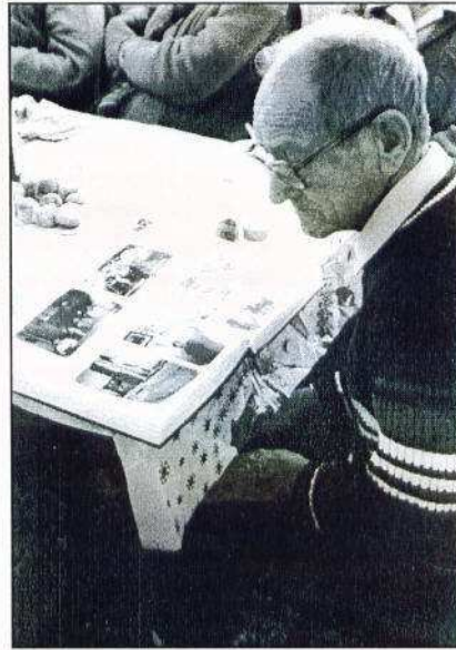
Lapozgatás a fotóalbumban