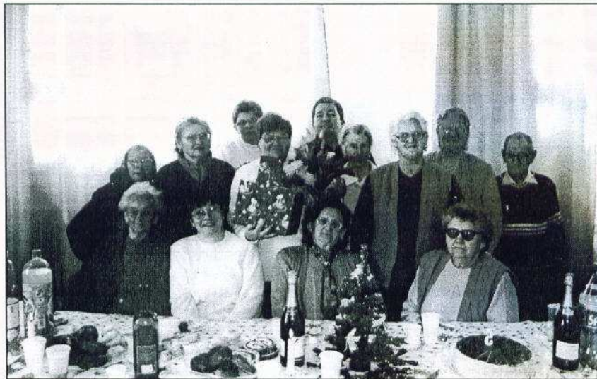
A Vakok és Gyengénlátók jászfényszaru csoportja

A Vakok és Gyengénlátók Klubja 2003. december 17-én tartotta az év utolsó klubfoglalkozását a karácsony jegyében. Ünneppel volt ez duplán is, hiszen 5 éves születésnapunkról is most emlékeztünk meg. Felidéztek az együtt töltött sok és szép napot, rendezvényeinket, kirándulásainkat. Az ünnepi asztalról nem hiányzott a torta, a sütemény, az üdítő és a pezsgő sem. A karácsonyfa alatt mindenkinek volt ajándék is. Meghiitt, családi hangulatban töltöttünk el 4-5 órát.