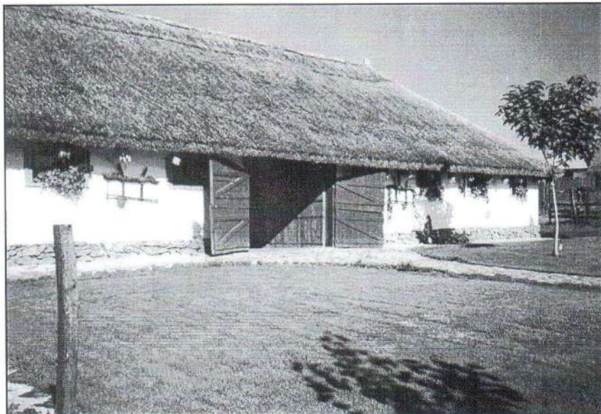
Püspökhatvanban ebben a takaros istállóban tartják a régen honos lófajtát, a hucult.

Október 10-én lakossági fórumot tartott dr. Gedei József, a Felső-Jászság, így városunk országgyűlési képviselője. Miután ismertette, hogy a választási programban megfogalmazott ígéretekkel miként is áll a kormányzat, a művelődési ház klubtermében megjelent érdeklődők inkább egy kerekasztal beszélgetés részesei lehettek. Tekintve, hogy az országos médiából is jól tájékozódhatnak olvasóink, ezért e tudósításban a szűkebb pátriánkra vonatkozó fejlesztésekre és a beszélgetés témáira koncentráltunk.