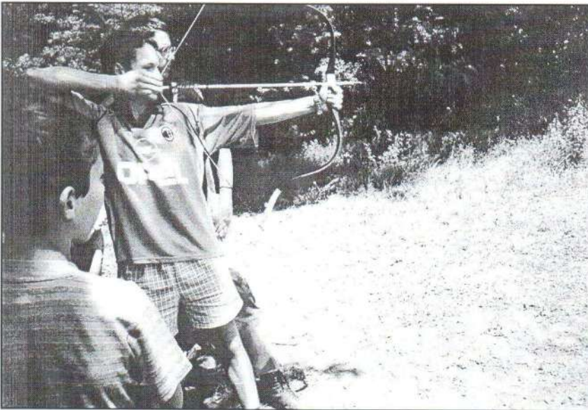
2. „Célra tarts!” Kisrosvágy: honfoglaló emlékek között.

Július 5-én reggel 49-en indultunk el az immár ismerős útra: a szlovák határon fekvő Pácin faluba. Több mint 260 km állt előttünk, hogy elérjük a tavaly nyáron szívünkbe zárt táborhelyet.