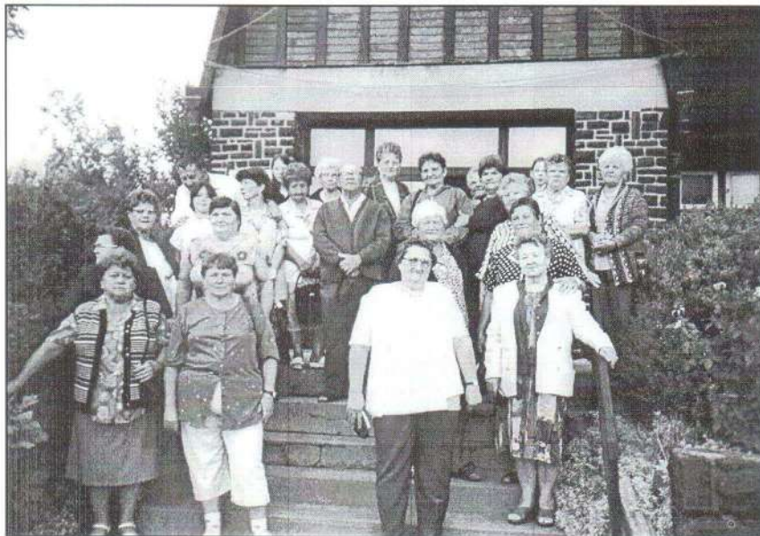
A mátrászentimrei templom előtt.

Július 26-án a Mátrába kirándultak az Őszirozsa nyugdíjas klub tagjai. A nap folyamán sok nevezetesen helyen megfordultunk.