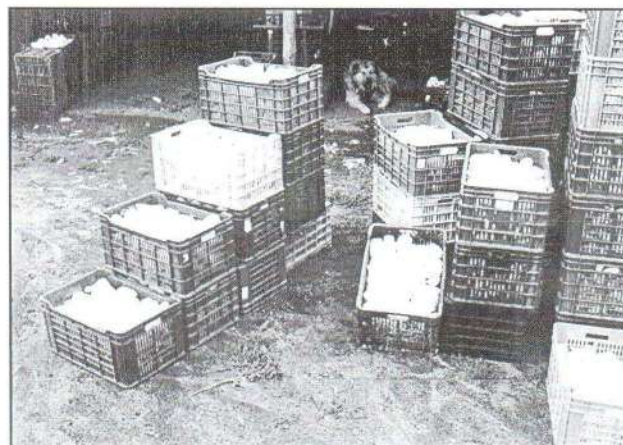
Szállításra kész a paprika is.