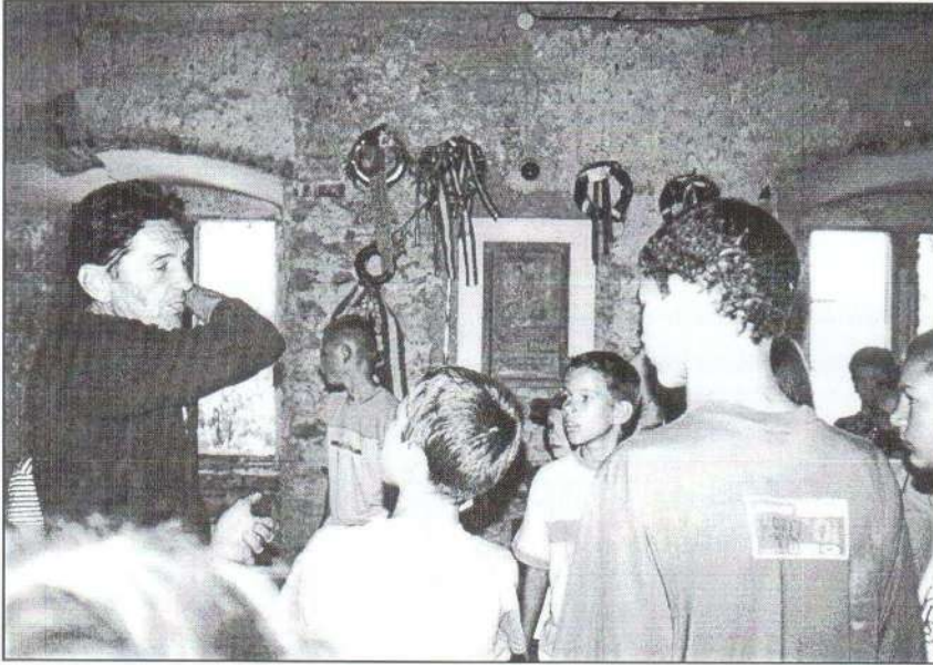
1. Szlovákia, Borsi: Az átszellemült idegenvezetőt hallgatjuk feszült figyelemmel a Rákóczi-várban.