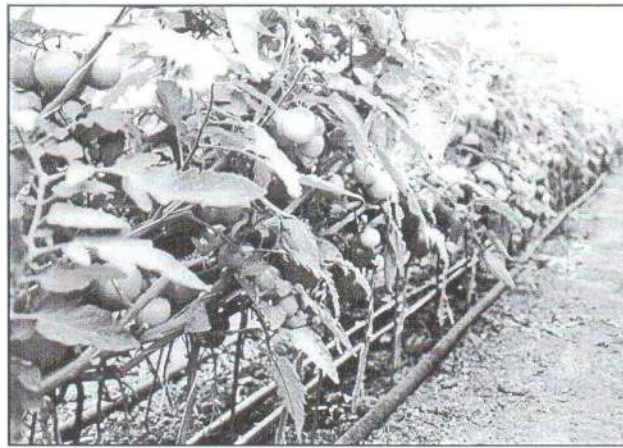
A növények gondozása mintaszerű.

Nem tudni miért, esetleg kin vagy min múlik, hogy szűkebb régiók zöldségtermesztői inkább az egyéni elgondolások szerint szervezik munkájukat. Aki hajlandó lenne társulni, nem akad társa. Egy TÉS (termelési és értékesítési szövetkezet) megalakulásához minimum 8 gazdálkodó kell, s ha ez sikerülne, akkor már csak egy felelős vezető hiányzik, aki összehangolja a teendőket a biztosabb jövedelmezőség érdekében.