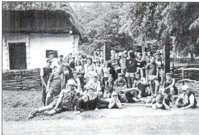
A zalaegerszegi skanzenben.