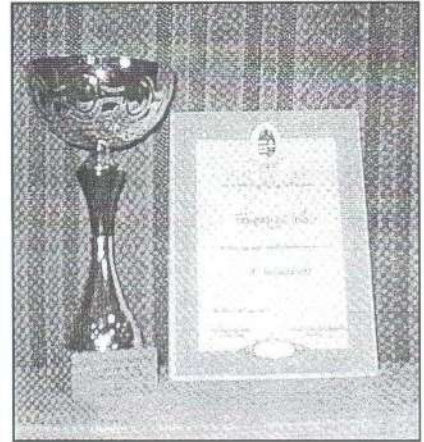
Serleg és emléklap a Fényszarui Triónak

A 6. Jász Expo Kiállítás és Vásárra kaptak meghívást a FÉBE Szücs Mihály Huszárbandérium asszonyai, lányai.