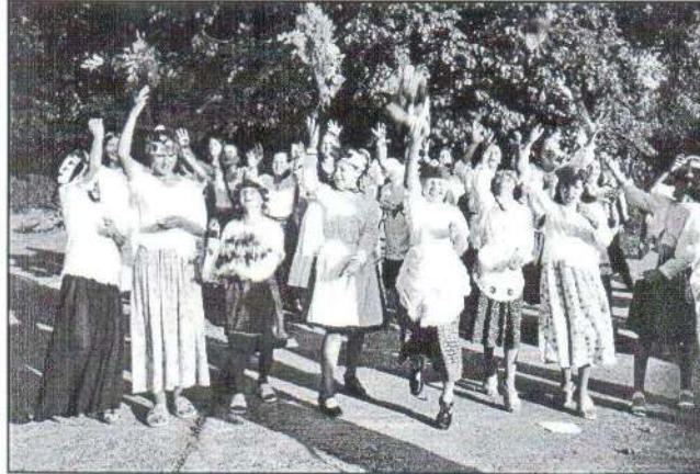
Ki kapja el a menyasszonyi csokrokat?