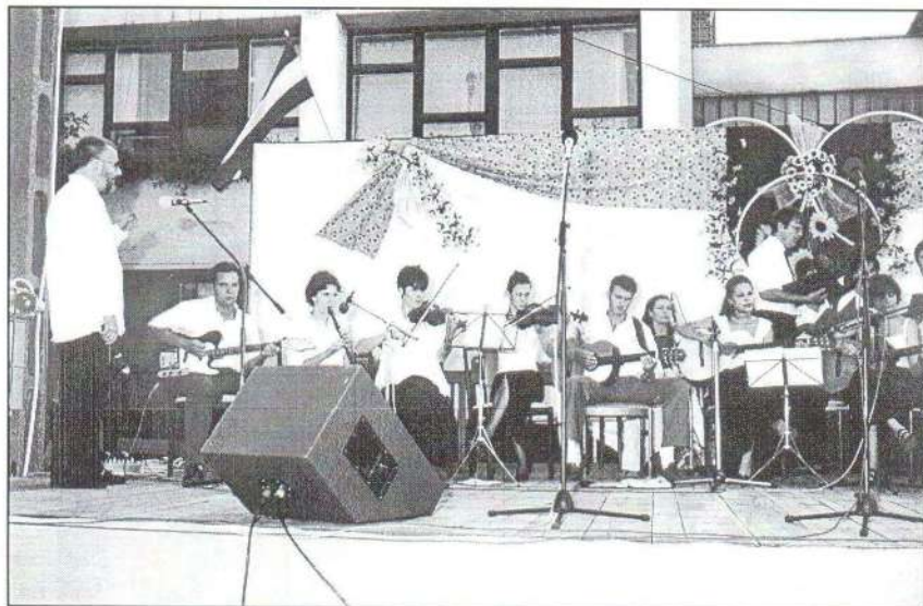
Szívéinkhöz szóltak a művészeti iskolások zenés műsorszámai.