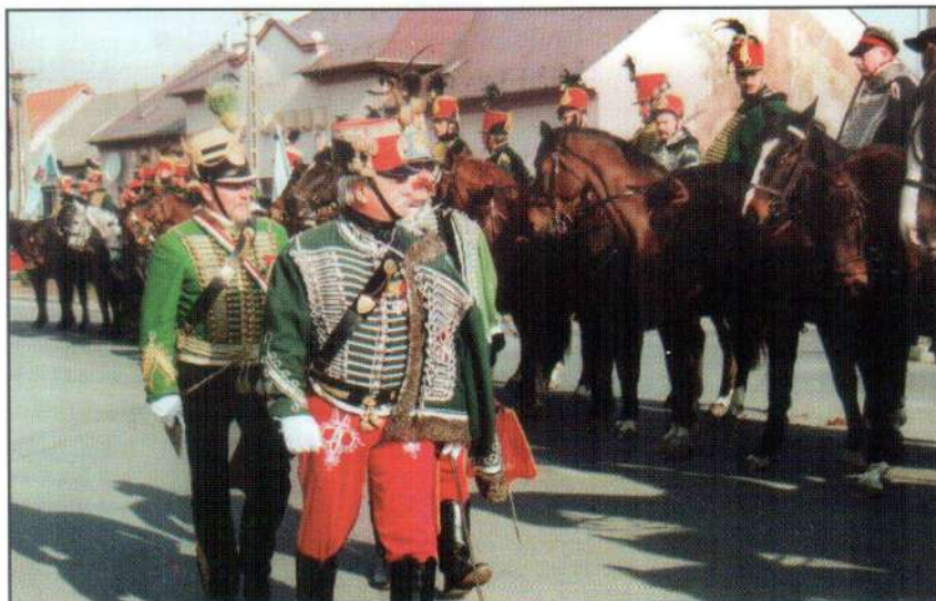
Közép-Európa legjelentősebb katonai hagyományörző rendezvénye kezdődött Jászfényszarun április 1-jén. A felvétel az április 2-ai díszszemlén készült. Részletes tudósítás későbbi lapszámunkban lesz olvasható.