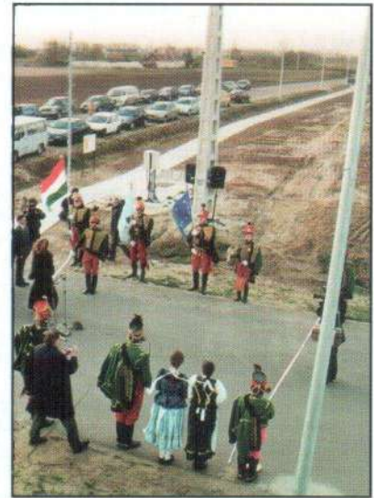
Az Ipari Park ünnepélyes átadása