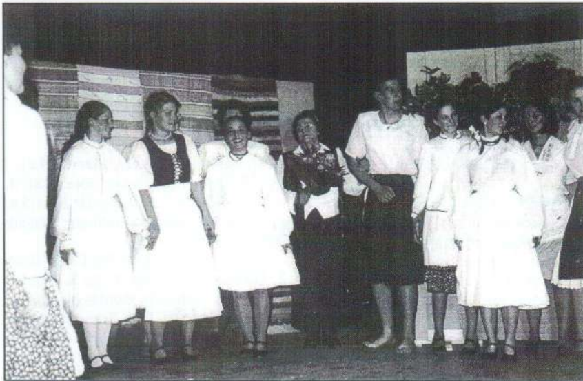
A Bolhabál jászfényszarui előadásán. Mielőtt a függöny legördül...

Vasárnap a Medve barlanghoz kirándultunk. Ezt a szép cseppkőbarlangot 10 éve adták át a látogatóknak. A kellemes kirándulólhelyről visszatérve még megálltunk a Várad melletti híres gyógyfürdőhelyen, Félix fürdőn, és sok felejthetetlen élménnyel tértünk haza kisvárosunkba. Bízunk benne, hogy a két nappal később, a Dicsőséges Tavasz Hadjárat jászfényszarui rendezvényeire érkezett borsói és nagyváradi vendégek is hasonló kellemes emlékekkel tértek haza, és ez a két látogatás újabb mérföldköve a 3 település közötti kapcsolatok ápolásának.