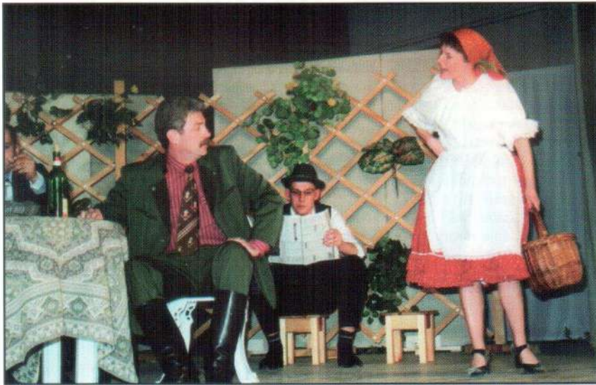
Szópárbaj Terus és a gazdatiszt között.

Rég nem tapasztalt élményben volt részük mindazoknak, akik március 23-án a művelődési ház nagytermében helyet foglaltak a nézőtérben: a Fortuna Együttes fennállásának 30. évfordulója alkalmából egész estét betöltő vidám színdarabot mutatott be. Nevezetesen Illyés Gyula Bolhabál című színművét adaptálták a fényzarui színpadra. A darab 1930-ban játszódik, valahol Magyarországon, s azt meséli el, miként leckéztetik meg a furfangos summások a gögös urakat.