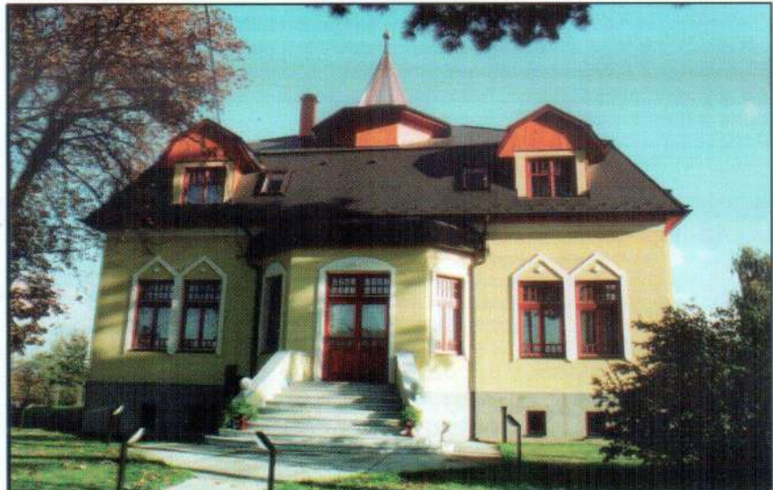
A Szabadság úti kastélyépület. Itt található a Penczner Pál terem.

beruházásban épülő szennyvíztisztító műszaki átadása.