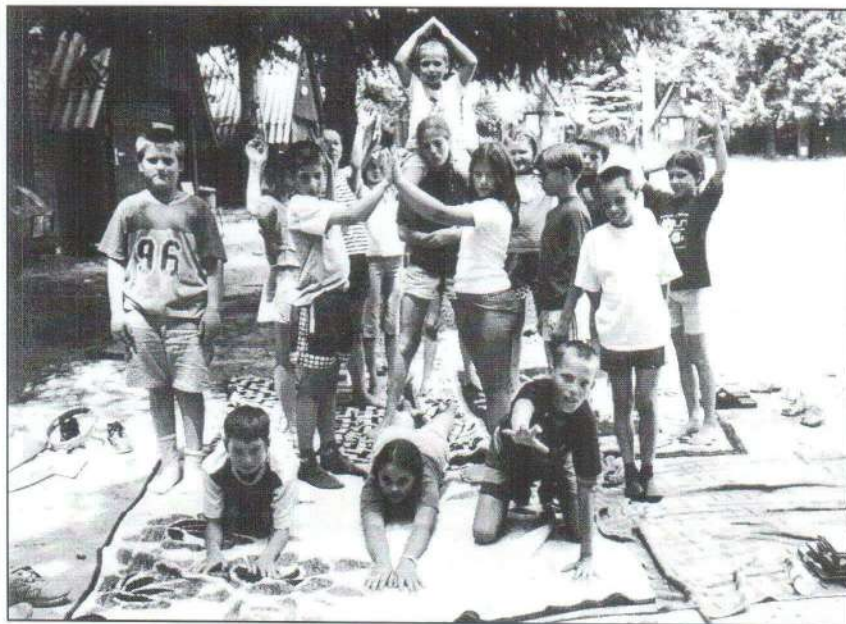
Testünkön épül a vár.