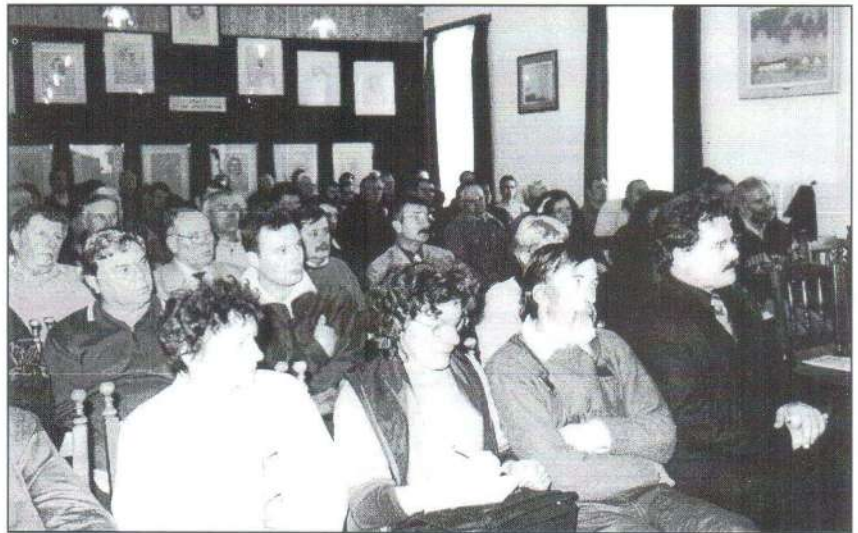
Az államtitkári tájékoztató hallgatósága

2003. február 11-én Benedek Fülöp címzetes államtitkár tartott tájékoztatót Jászfényszarun. A Városháza nagyterme megtelt az érdeklődőkkel, térségi polgármesterek, falugazdászok és gazdálkodók voltak jelen.