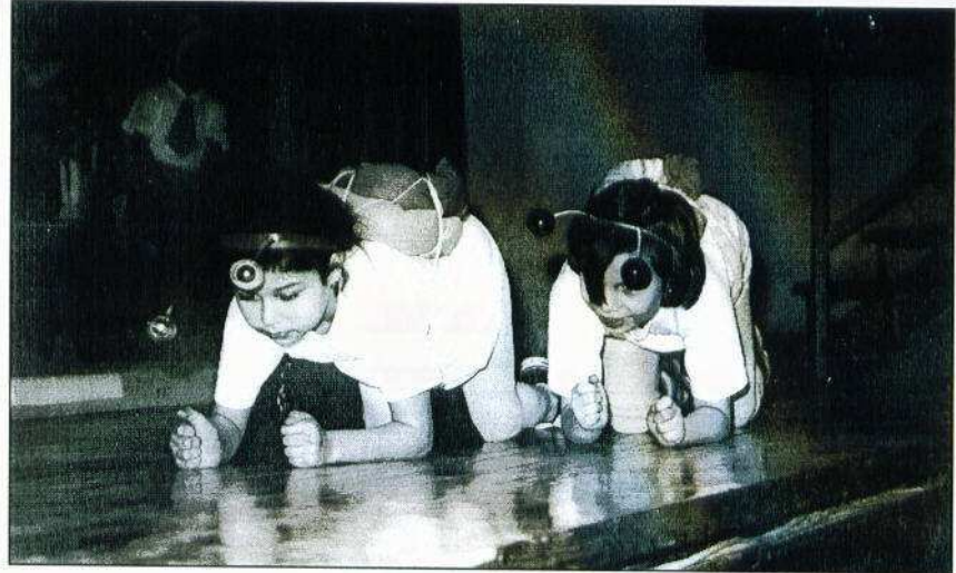
Törpolimpia (III. A)