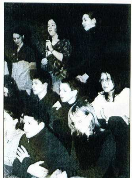
Murphy törvények (VIII. A)