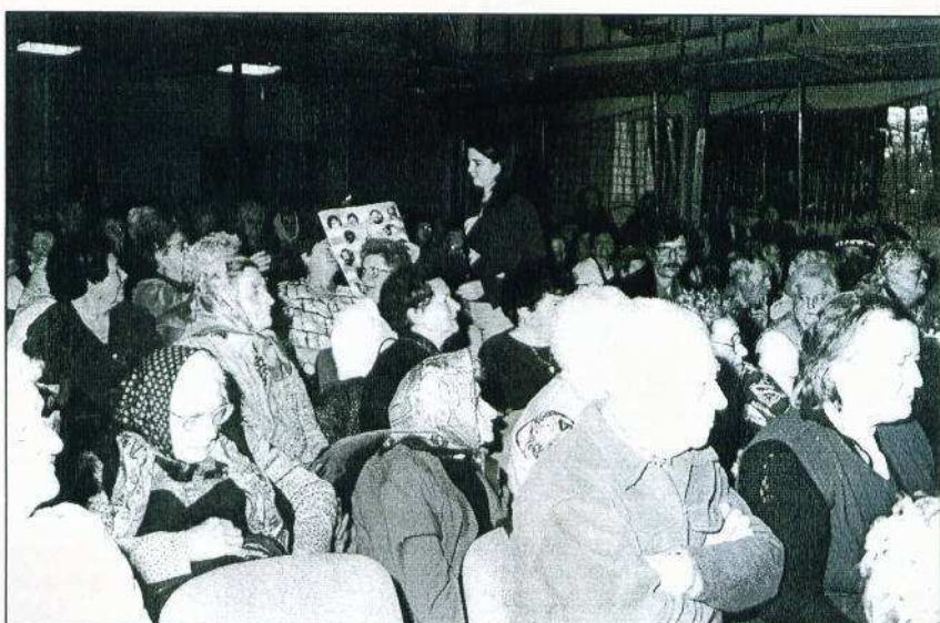
Előző lapszámunkban cikket közöltünk az önkormányzat december 7-ei rendezvényéről, amelyen ezek a fényképek készültek. Fent: jelenet a fővárosi művészek műsorából. Lent: a tombolasorsolás.