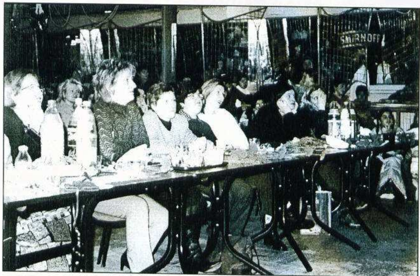
Döntés előtt a zsűri

Január 10-én rendezte meg a Diákönkormányzat a hagyományos Ki mit tud-ot. A bemutatóra szinte az iskola minden diákja és pedagógusa nagy odaadással és izgalommal készült. A zsűri hosszas töprengés után választotta ki azokat a produkciókat, amelyek a január 25-én megrendezett VIII. jótékonyági bál műsorát adták. Felvételeink a válogatón és a január 23-ai jelmezés főpróbán készültek.