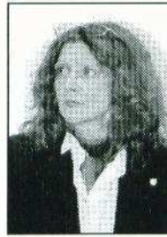
Györiné dr. Czeplédi Márta polgármester