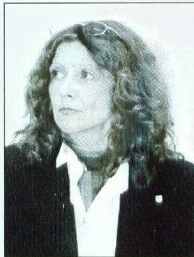
Györiné dr. Czeglédi Márta polgármester