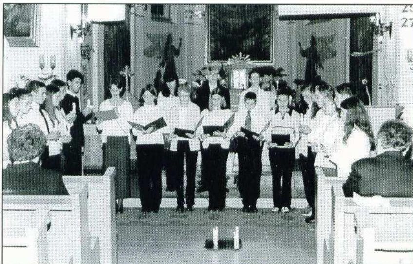
Megemlékezés a templomban nemzeti ünnepünkön, október 23-án.