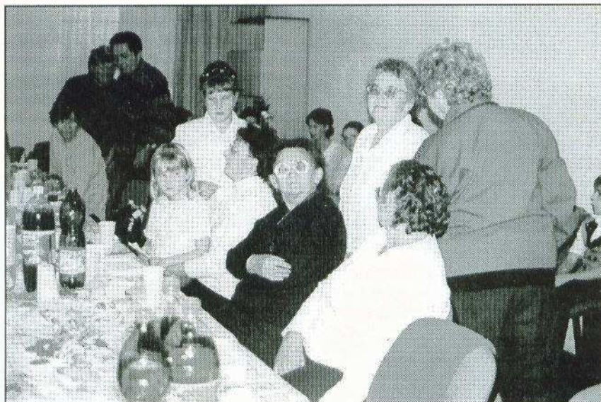
Tere-feré. Az ünnepi készülődés.