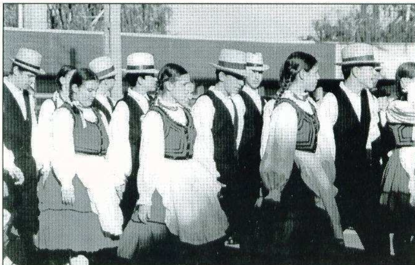
Felvonulás Jászfényszaru utcáin. Az október 5-i Fény Fesztivál résztvevőinek egy csoportja.