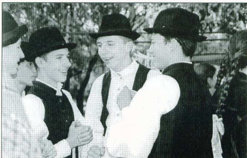
Vajon, miről beszélgetnek? Néptáncos fiúk a művelődési ház előtt.