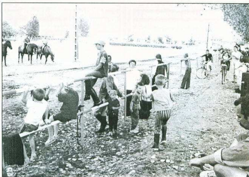
Felvételünk a július 9-i lovasprogramon készült, mely a Szücs Mihály Huszárbandérium közreműködésével valósult meg.