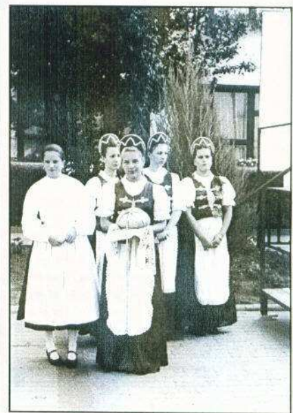
Az államalapító Szent István király tiszteletére rendezett városi ünnepségünkről készült beszámoló újságunk 3. oldalán olvasható.