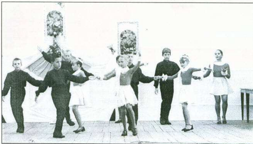
A Borostyán Társastáncklub legifjabbjai

Az ünnepséghez szorosan hozzátartozott mindazok munkája, akik felépítették a színpadot, kezelték a műszaki berendezéseket, biztosították a zavartalan ünnepelést, közreműködtek a helyi műsorszámok létrejöttében.