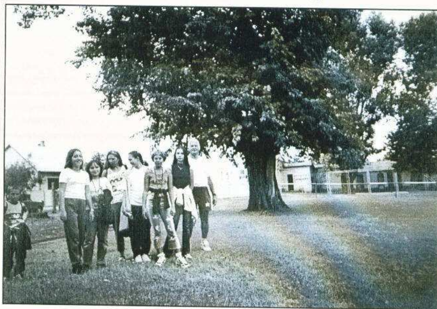
A táborozók a fényszarui Sportpályán. Háttérben egy öreg eperfa.

Hetedik alkalommal szervezte meg a FÉBE fiatalok részére a honismereti tábor. Július 22-én, a bizonytalan időjárást ígérő első táborozási napon, a Civilházban maradtunk és beszélgettünk elődeink életmódjáról, szokásairól, településünk régi utcaneveiről, tájneveiről és környezeti sajátosságairól. Közben meglátogattuk Szilágy Dezső fafaragó népi iparművészt, érdeklődtünk pályafutása és munkássága iránt. Ezután átsétáltunk a régi vásártérre, a mai sportpálya környékére. Megkerestük a régi emlékekből ismert, egykor selyemhernyó tenyésztés célját szolgáló néhány eperfa matuzsálemet. Ámulattal szemléltük a mintegy másfél méter átmérőjű törzsüket, mesébe illő ágkoronájukat és hatalmas lombátjukat.