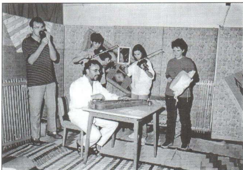
Akik az estéknenti jó hangulatról gondoskodtak: a művészeti alapiskola zenekara.