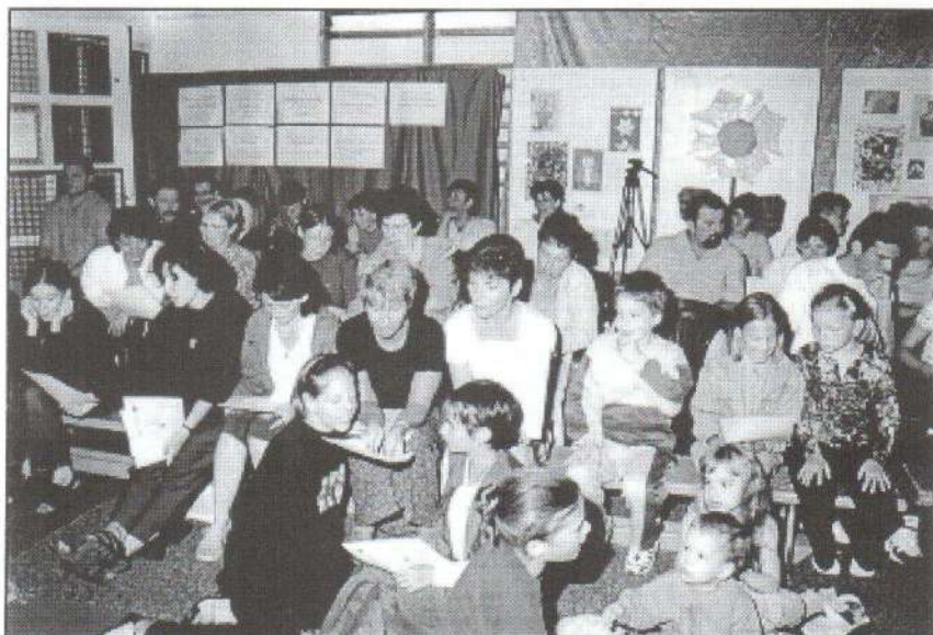
Jó együtt új dalokat tanulni.

Napjainkban egyre inkább bebizonyosodik, hogy csakis sok ember és szervezet mind nagyobb összefogásával valósítható meg egy kisváros számára nagy rendezvénynek számító, de mégis emberléptékű és emberközpontú rendezvény. Köszönjük az együttműködést! Bizunk abban, hogy az általunk teremtett hagyomány a későbbiekben sem szakad meg, mert hisszük, hogy ezzel városunk lakossága is gazdagodik.