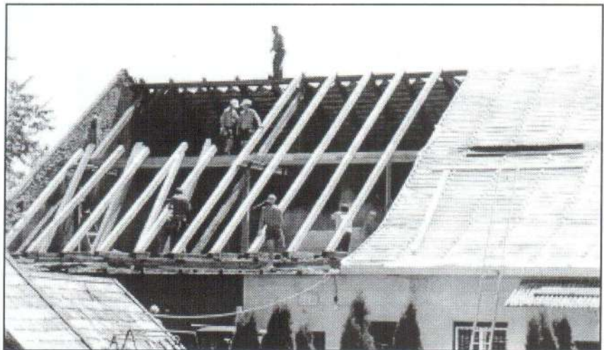
Júliusban befejeződött a Kaszinó Étterem tetőcseréje.

Jászfényszaru önkormányzata támogatja a 2002/2003-as tanévre szóló általános iskolás tankönyvek megvásárlását. A támogatás mértékéről illetve a különböző évfolyamoknál fizetendő összegéről hamarosan tájékozódhatnak a szülők az iskolánál kifüggesztett listán.