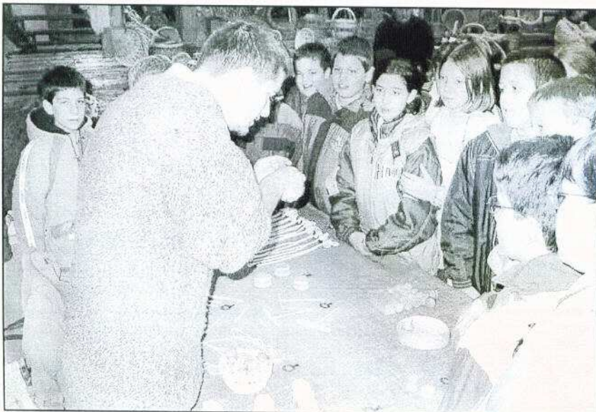
Nagy sikere volt a fából készült népi gyermekjátékoknak.