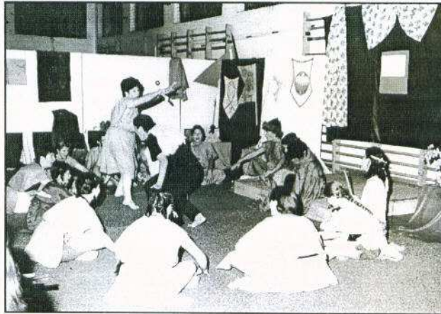
Drámai pillanat a tornateremben.

nevével, zászlóval, címerrel, himnusszal és imával jelentek meg már a 2. napon és bemutatták eredetmondájukat is. A keret a nagycsoportos találkozás, együttlét volt reggel és este, amikor hírt küldtünk illetve kaptunk a királytól (lovakon érkezett futárok által), miközben kis csoportokban