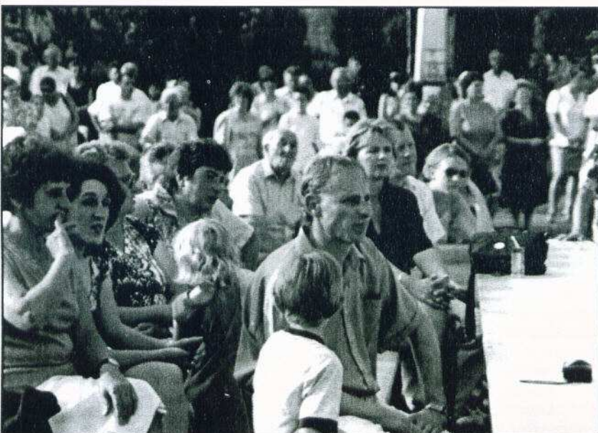
Ittmaradtak, ide költöztek, hazajöttek