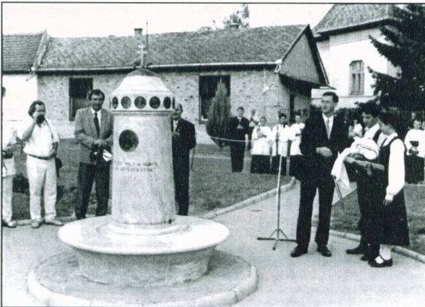
A díszkút teleplezve