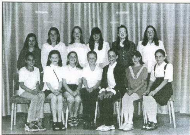
Az 5-6. osztályos lányok.