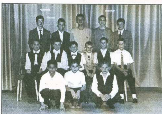
A felsőtagozatos fiúk.