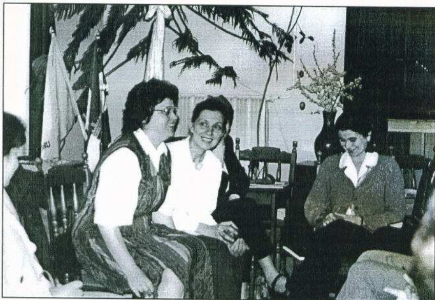
Pillanatkép a délutáni szekció ülésről.

Az előadásokat követő fórumon több olyan problémakör is felvetődött, amelyet a délutáni szekcióüléseken vitattak meg. A küldöttek javasolták, hogy a felszínre került szakmai anomáliákat fogalmazzza meg a konferencia, és továbbítsa azt az illetékes szerveknek, intézményeknek.