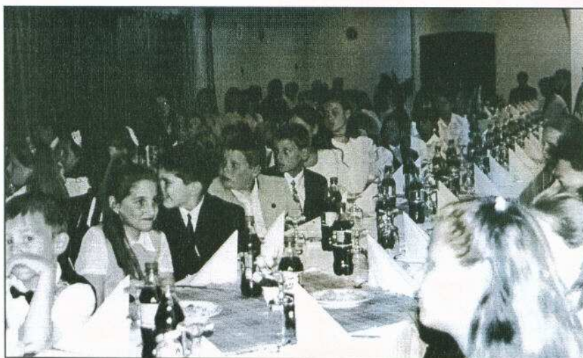
Az ünnepi asztalnál