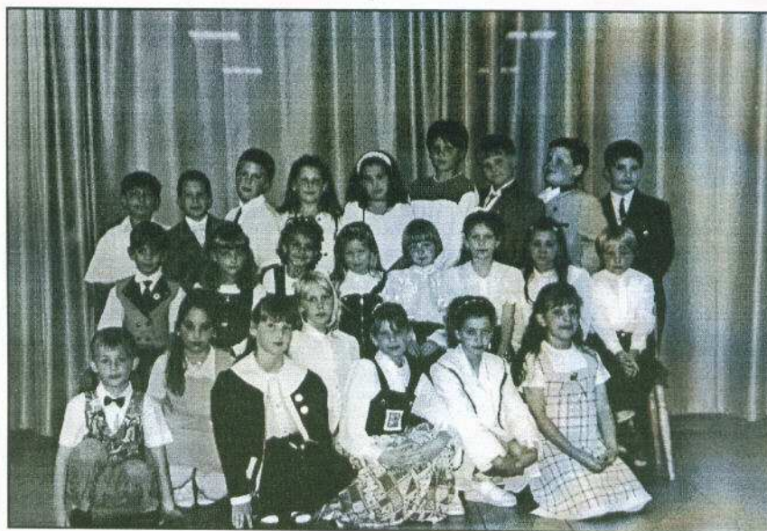
A fogadás alsó tagozatos résztvevői