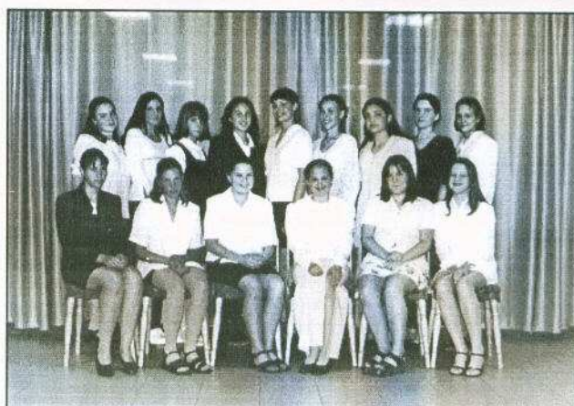
A 7-8. osztályos lányok.