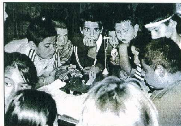
Végállomás: Strasbourg, azaz a művelődési ház nagyterme.