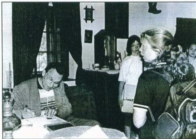
A Tájháznál történelmi tárgyú feladatokat kellett megoldani.